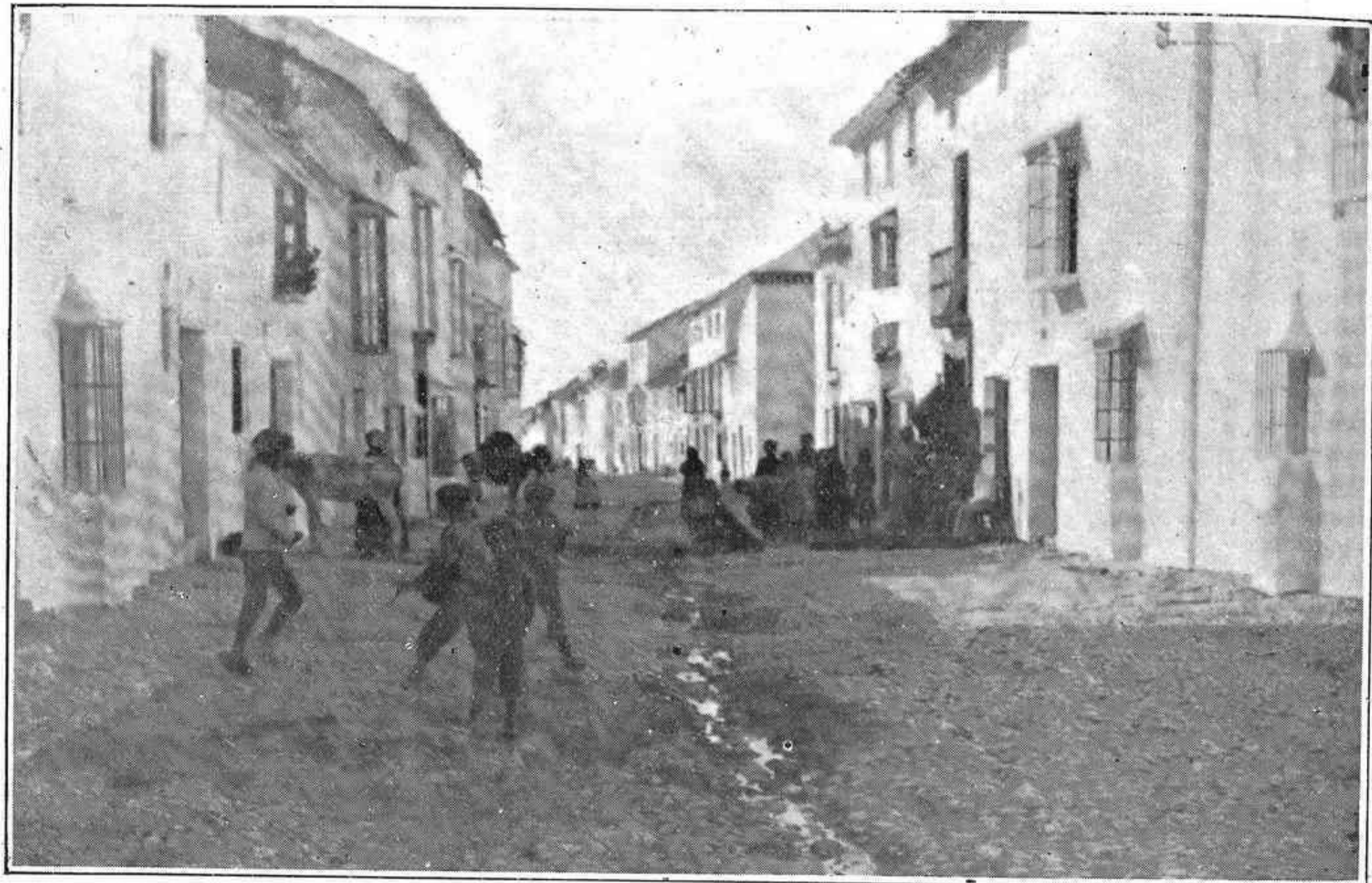
— La calle Mediabarba —

En nuestra informaciones gráficas hemos dado, de los típicos barrios lucentinos, algunas notas que prometíamos ampliar. Hoy reproducimos en nuestro fotograbado la calle Mediabarba, una de las más hermosas de esa parte baja de la ciudad, en que llama la atención la extraordinaria amplitud de las vías que la cruzan y de la mayor parte de sus casas, con enormes portales y patios inmensos, que parecen lejíos (ejidos) según frase de sus habitantes.