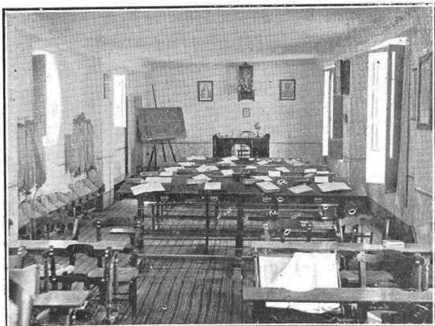
Clase de 3. er grado de estudio y labor

Es, este Colegio, uno de los más antiguos y hermosos de nuestra ciudad; la completísima enseñanza que en él se dá, inspirada en los adelantos más recientes de la Pedagogía femenina, es su mayor recomendación; pruébanlo las varias exposiciones de labores que en el transcurso de poco tiempo hemos admirado; artísticamente instaladas, profusamente nutridas todas las secciones del extenso ciclo de la enseñanza femenina, y admiradas por infinidad de personas de dentro y fuera de la población, hubieran de poner