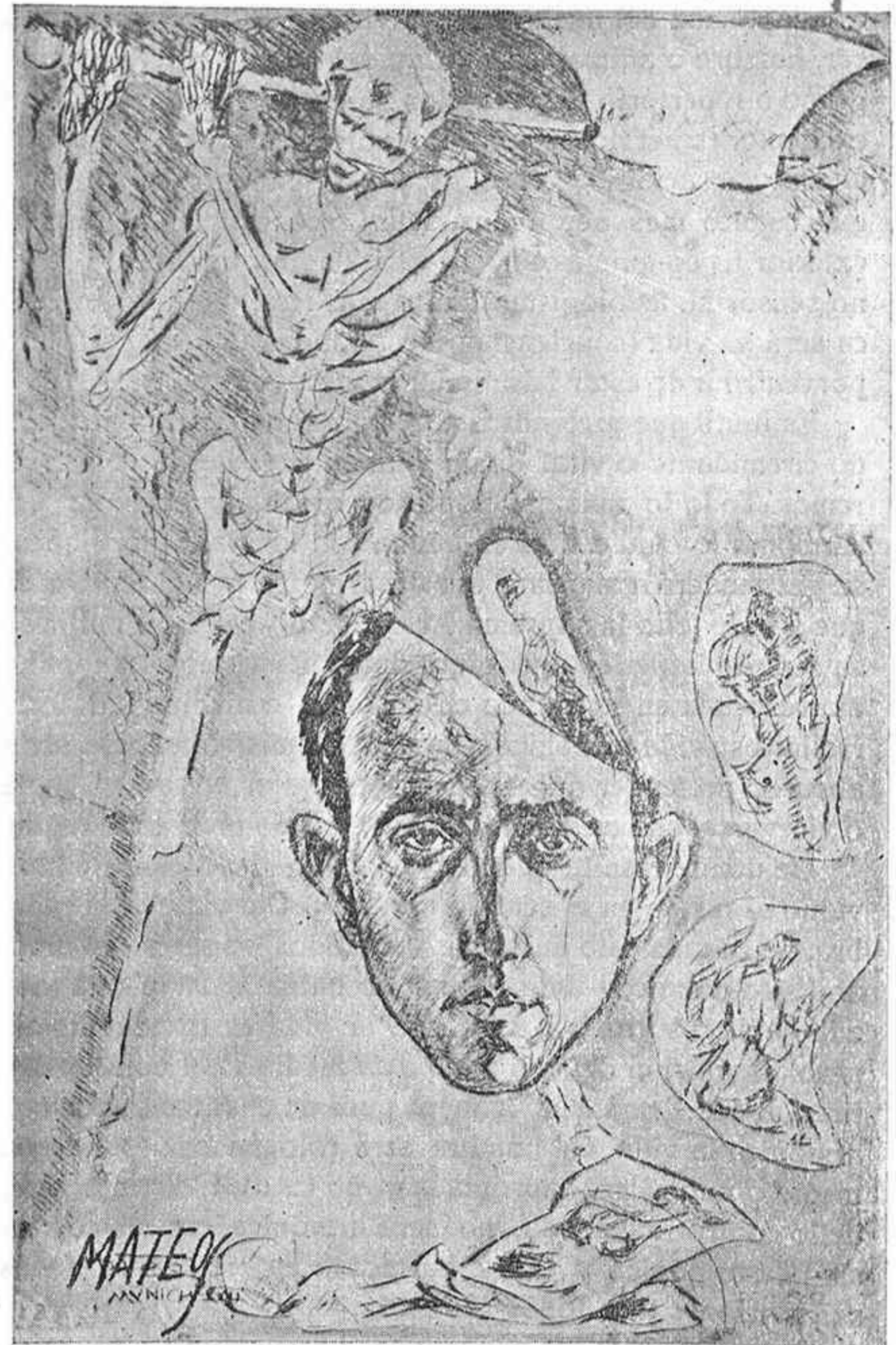
El dibujante.—Autorretrato.—Aguafuerte por Mateos

Lea V. Torbellinos en la Huerta, novela por Bersandín, 4 pesetas en todas las librerías.