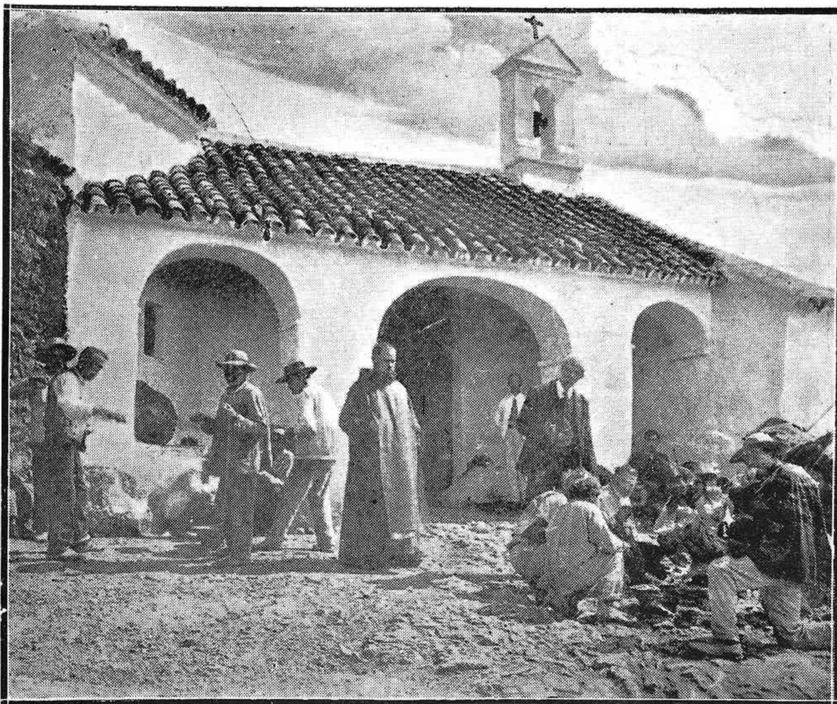
CÓRDOBA: Las Ermitas: Puerta principal, a la hora del reparto de la comida a los pobres

Organo de la Federación de Sindicatos Católico-Agrarios de Córdoba