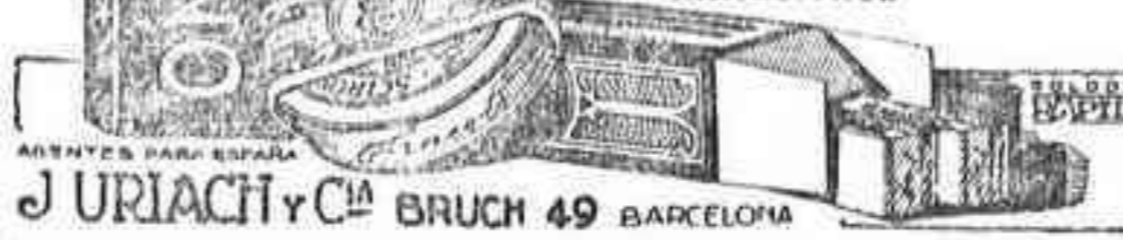
J. URIACH y Cia BRUCH 49 BARCELONA

LIQUIDO - POLVOS - COMPRIMIDOS Depurativo, Preventivo y curativo de todas las enfermedades del Hígado, Bilis, Intestinos, Estómago y Enterañas Desconfiad de las Imitaciones