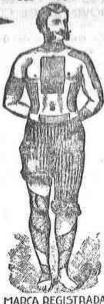
MARCA REGISTRADA EXIGIDA EN LA CUBIERTA DE CADA EMPLEASTO