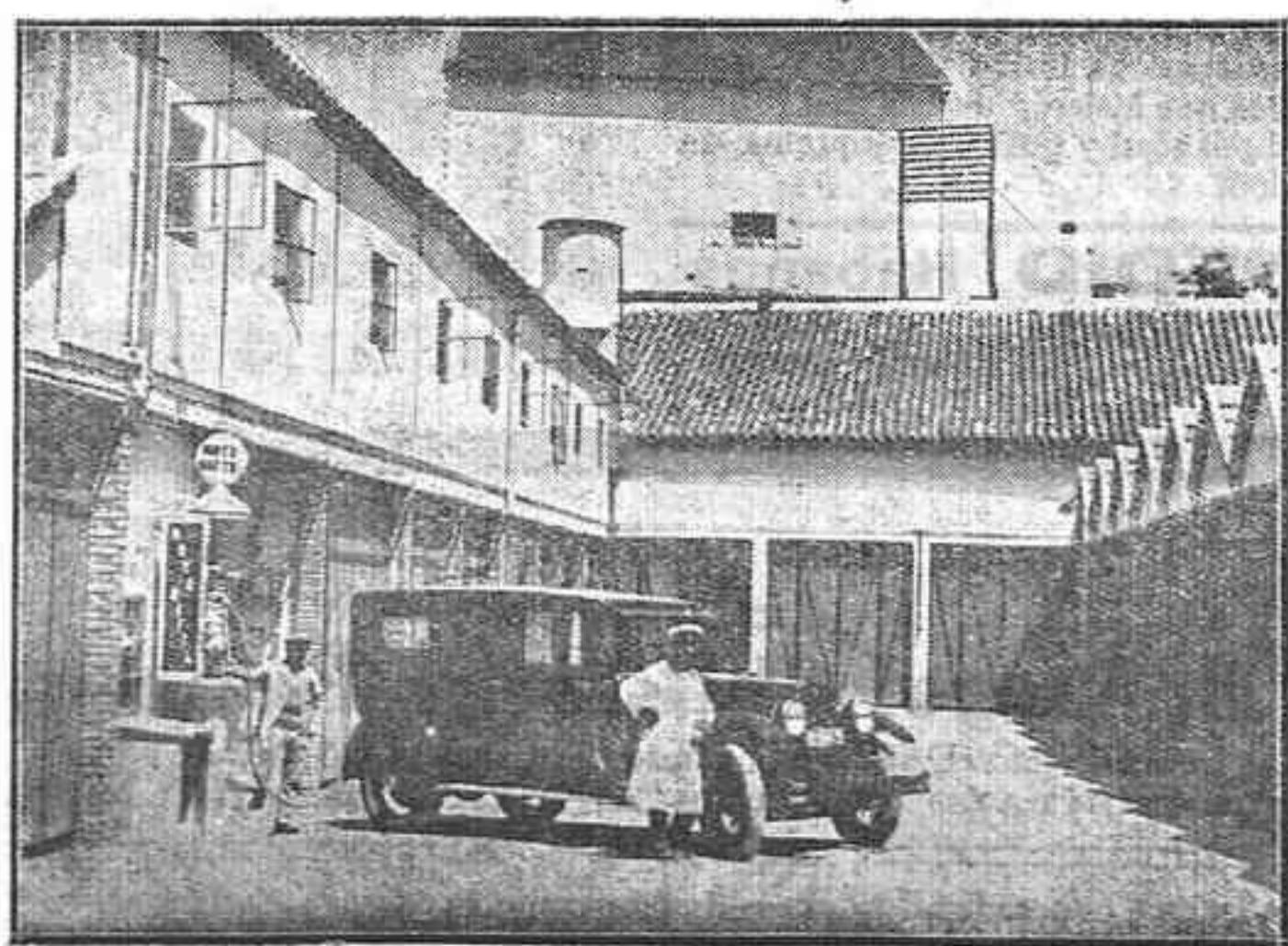
Cocheras del patio de entrada

Queda abierto un registro diario del movimiento de los coches de estancia en este Garage para que sus dueños, en cualquier momento, sepan las horas de salida y entrada de los mismos.