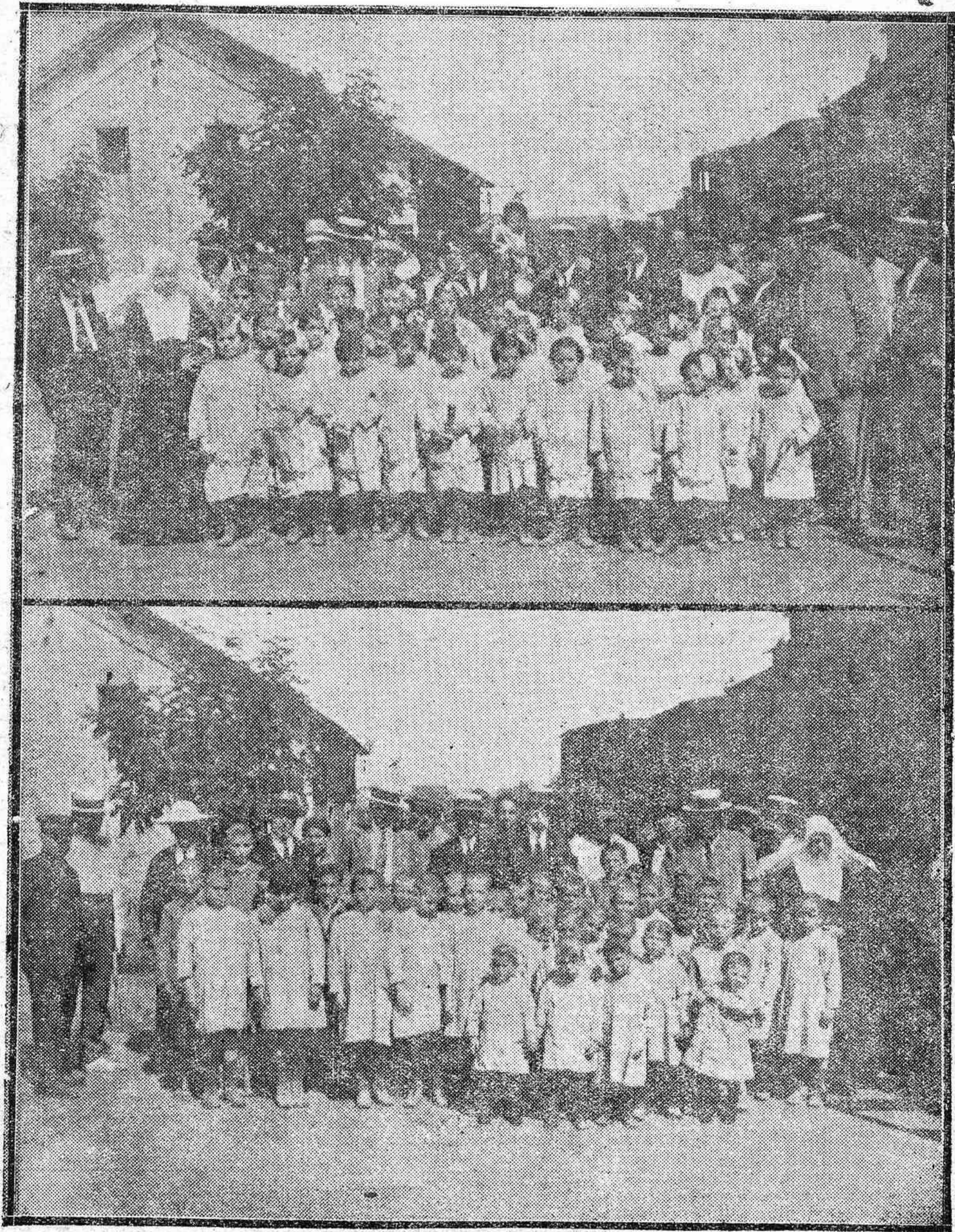
La segunda Colonia de Salud, compuesta por hospicianitos de ambos sexos, que nuestra Diputación ha enviado al Cerro Muriano.