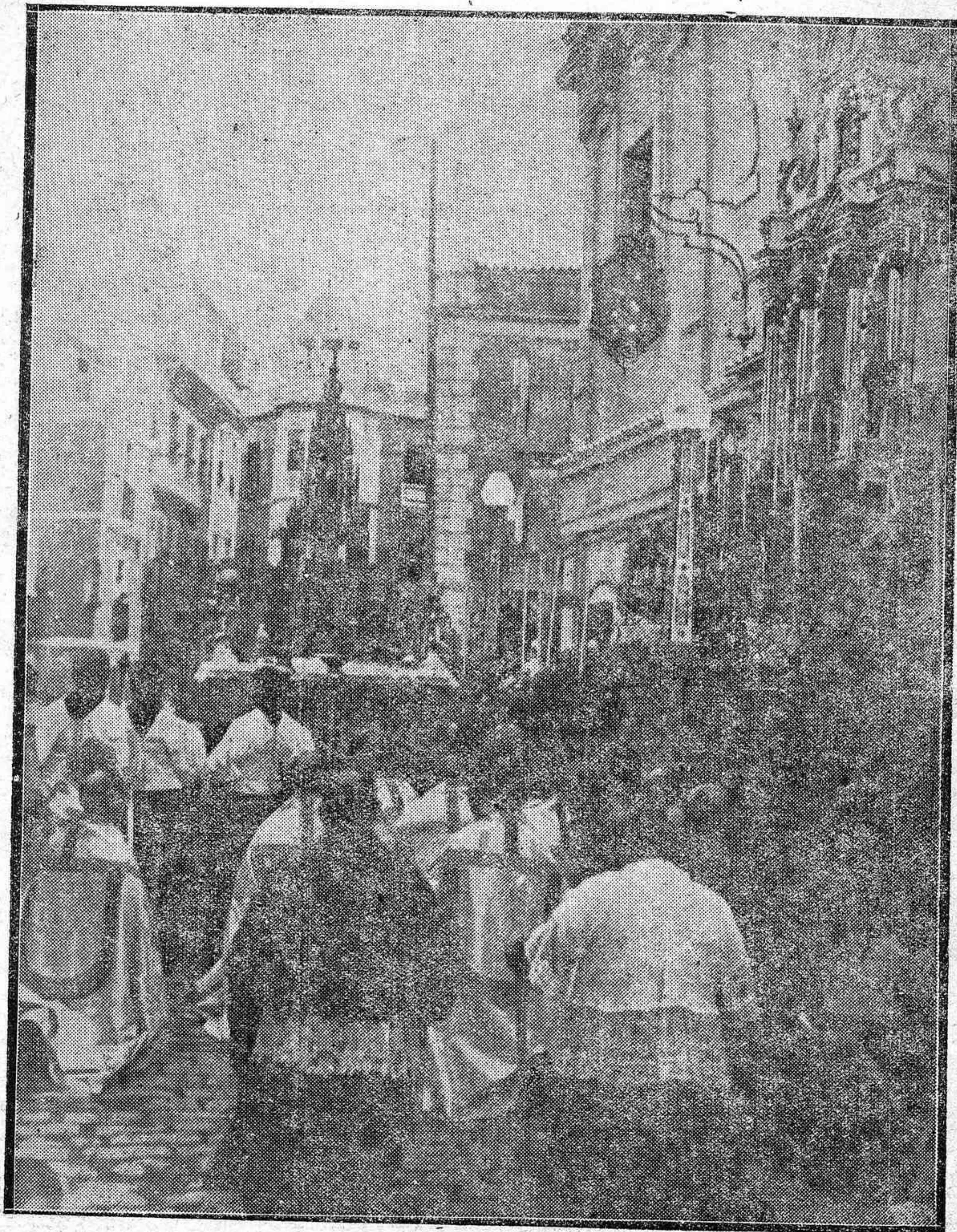
La procesión del Corpus Christi a su paso por las calles de la capital.