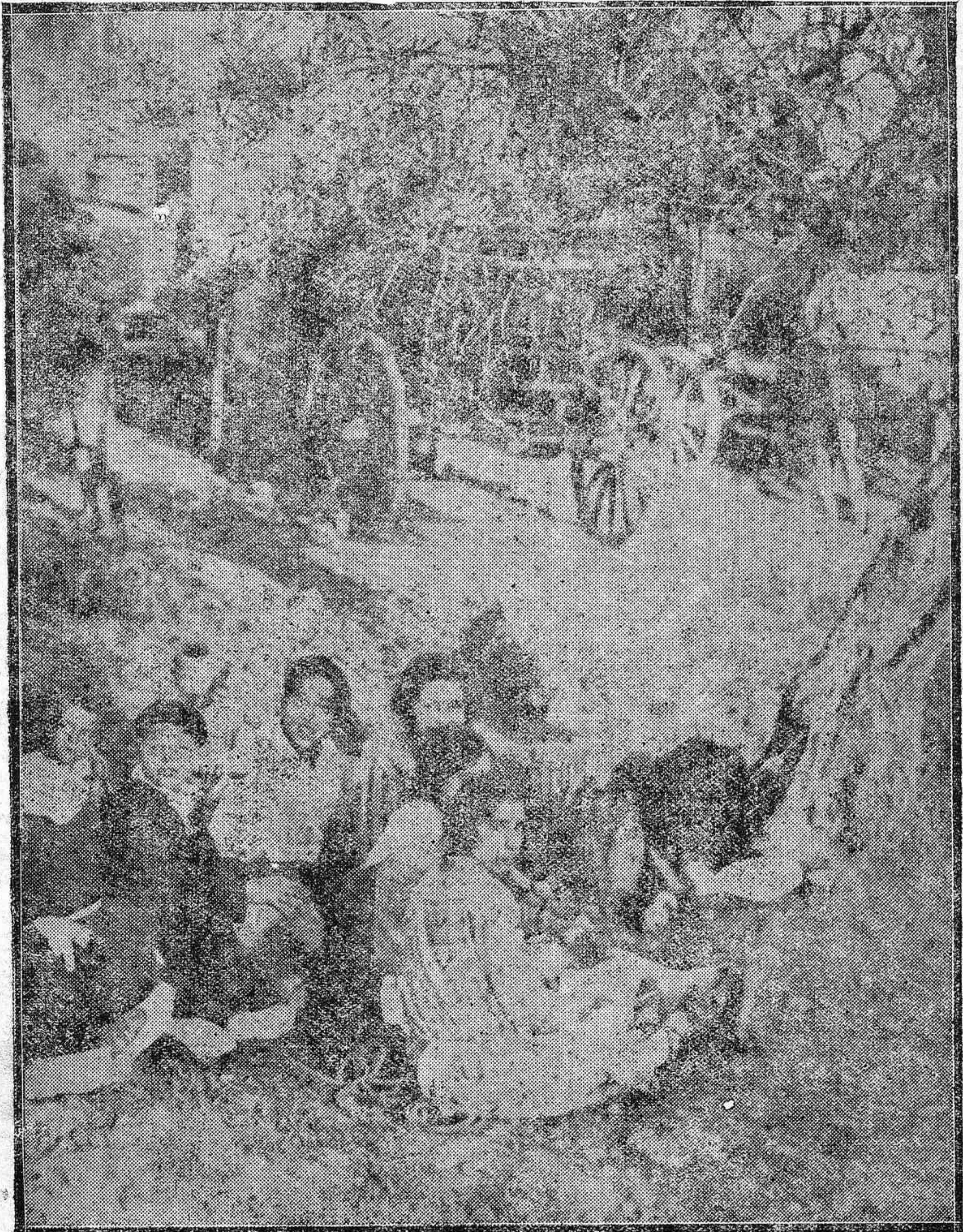
LAS ROMERIAS CORDOBESAS. ---Un clásico "perol" de los habidos el último día en las proximidades del santuario de Linares.