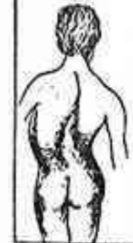
HERNIA CON CORRIENTE ELÉCTRICA