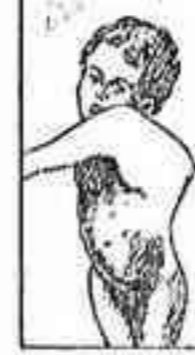
HERNIA CON CORSETA