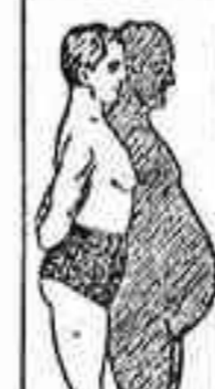
HERNIA CON MICROFONOS

sin operación ni molestias con el herniario IDEAL MORA , última creación de la Ortopedia moderna. La segura eficacia de este aparato es un remedio radical para curar toda clase de HERNIAS (quebraduras), por rebeldes y voluminosas que sean, incluso las reproducidas después de la operación.