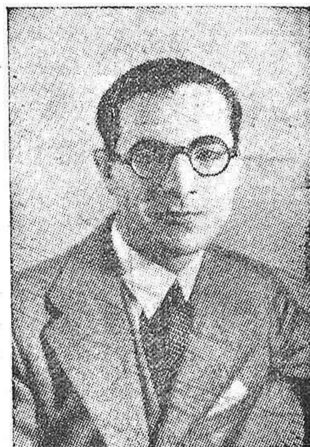
JOSÉ MONTERO ALONSO, NOTABLE ESCRITOR Y BRILLANTE PERIODISTA, AL QUE HA SIDO CONCEDIDO EL PREMIO DE LITERATURA ESPAÑOLA DE 1928.