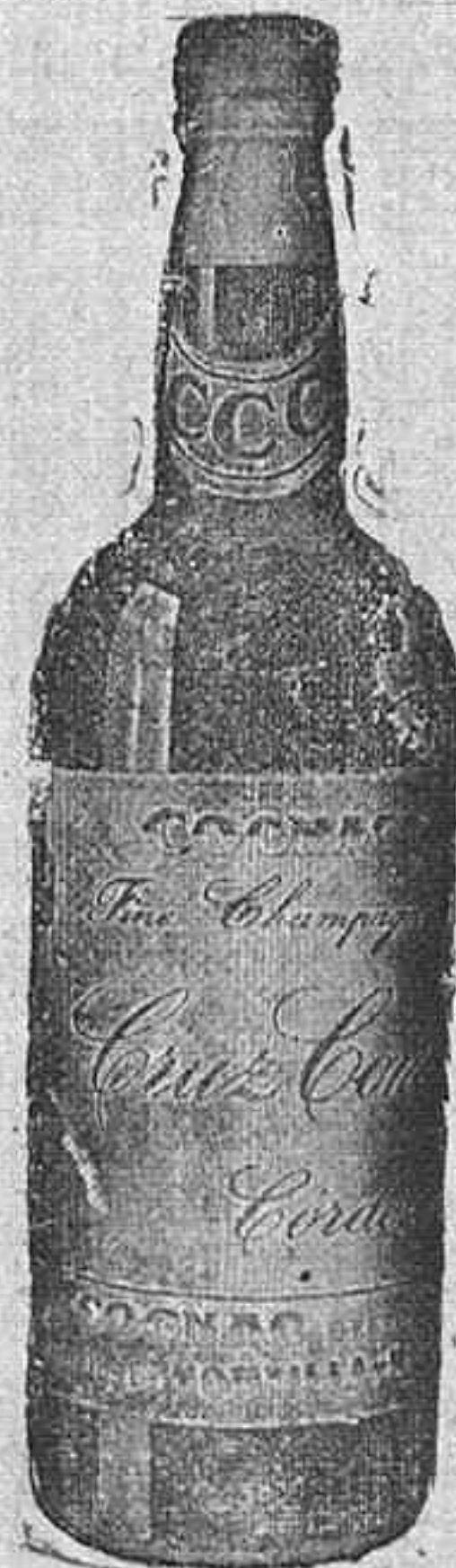
Coñac Cruz Conde

Rogamos a nuestros corresponsales que en el plazo más breve y para asegurarnos de la autenticidad de sus comunicados, remitan a esta Dirección una ficha en papel conteniendo el nombre y rúbrica de cada uno.