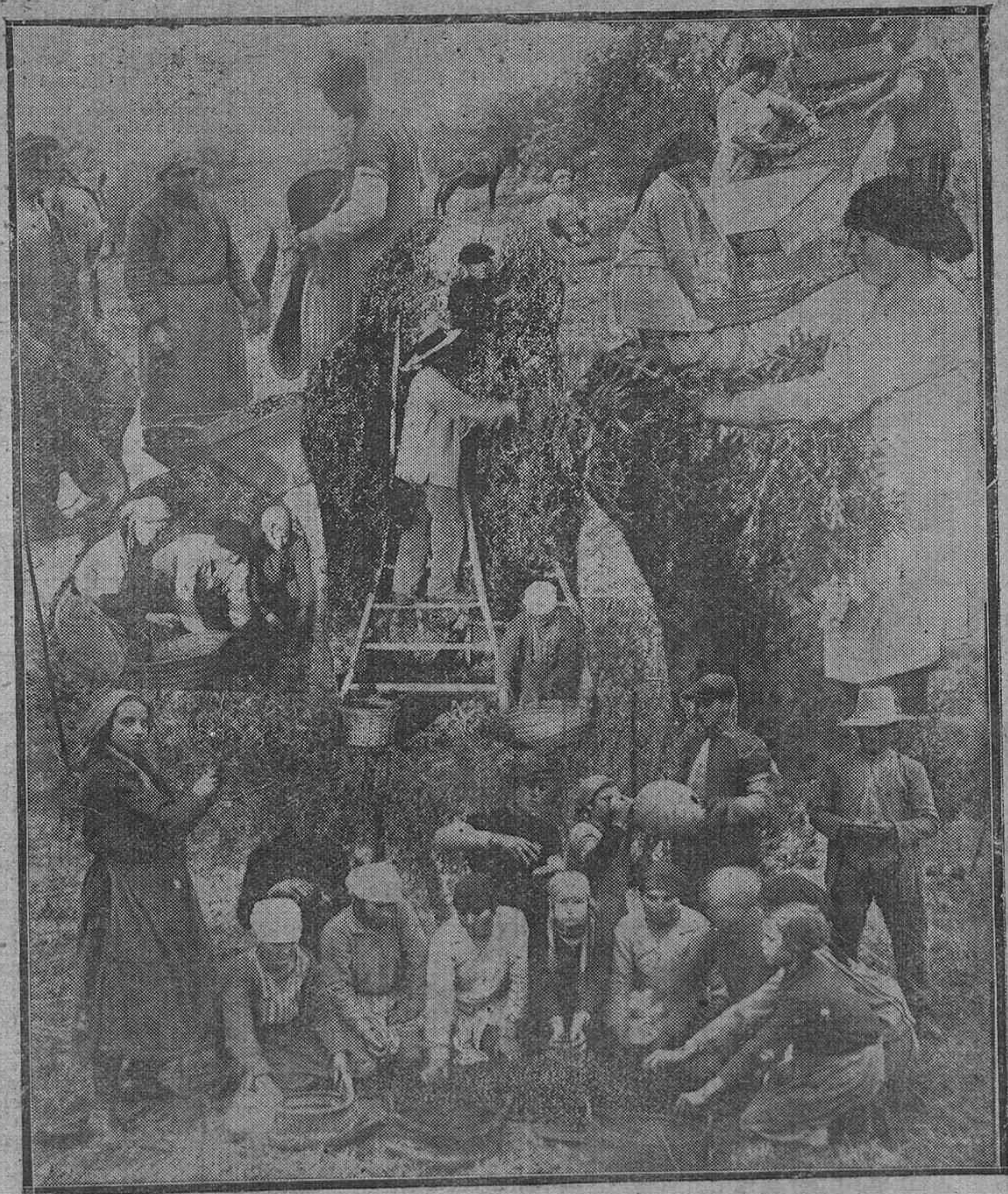
POR LOS CAMPOS CORDOBESSES. — Distintas faenas de la recolección de la aceituna, que constituye la principal riqueza de la región andaluza. — En el centro, una bella campesina "ordeñando" un olivo.