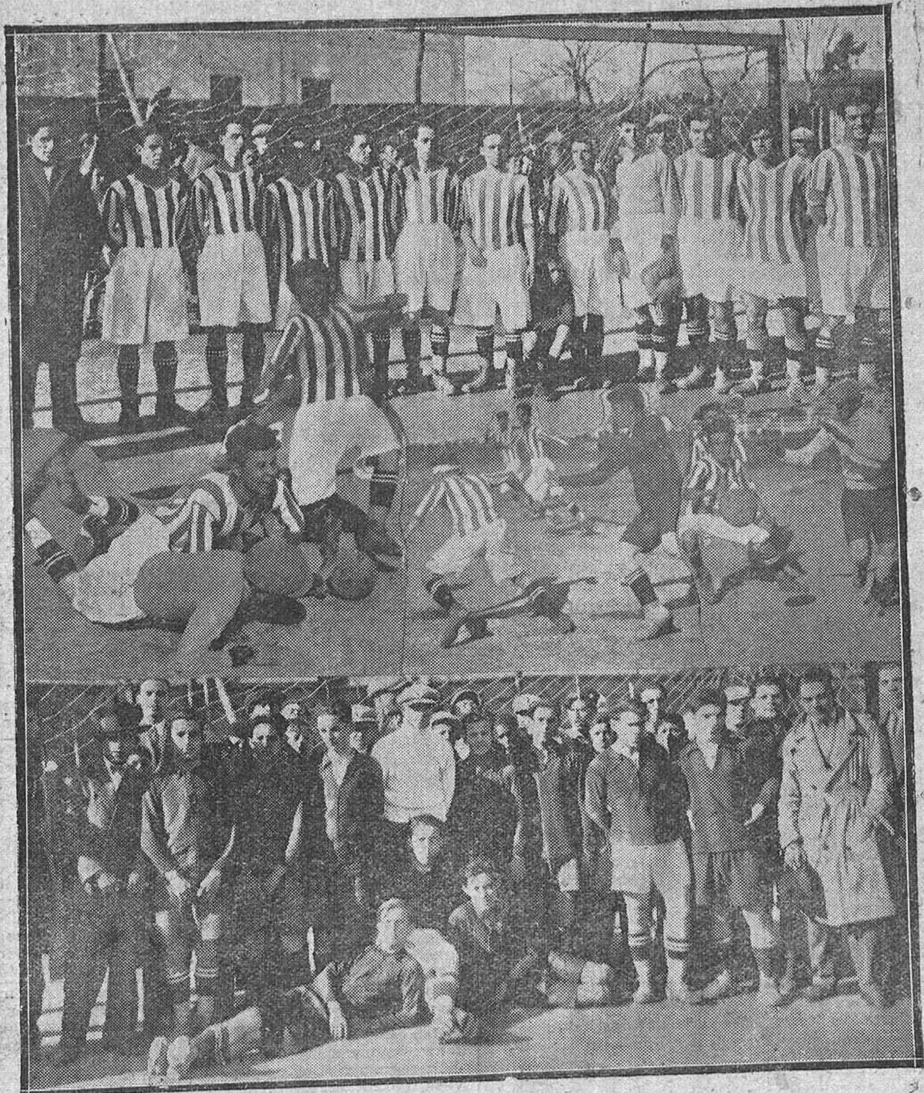
EL CAMPEONATO LOCAL.—Los equipos Unión Balompíe y la Balompédica, que han intervenido últimamente, venciendo el primero por 4 tantos a 0.—Varios momentos del partido.