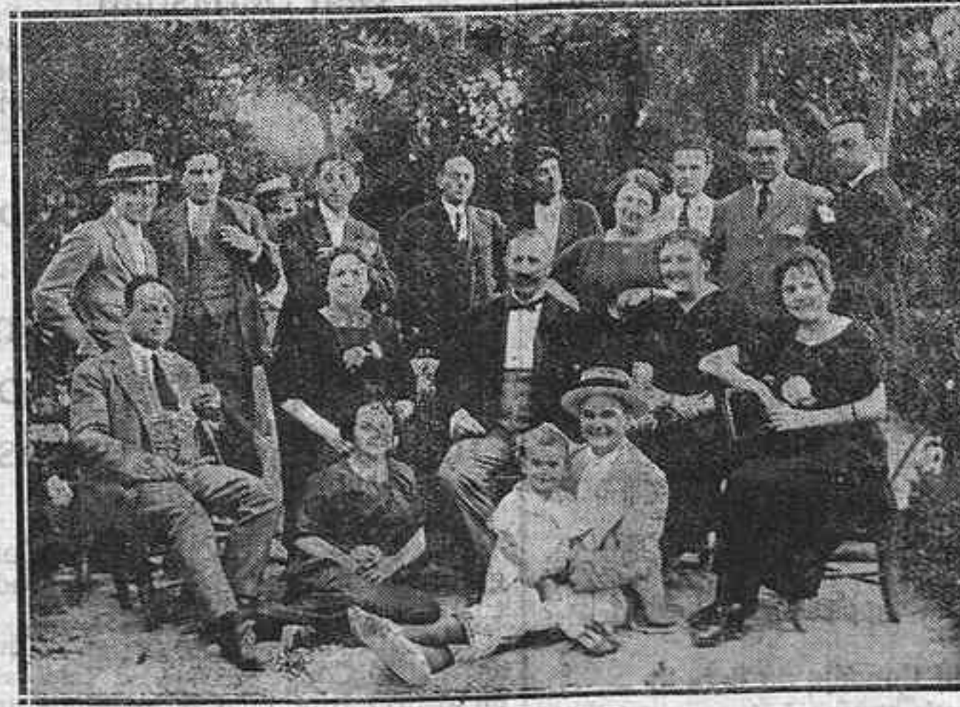
Individuos de la compañía de comedias de Benito Cibrán que actúa con gran éxito en el teatro de Puente Genil, acompañados de algunos amigos y admiradores

La S. A. Ingeniería y construcciones en Pedro Abad admite toda clase de peones y mineros para la construcción del tunel del Carpio OFICINAS: CALLE ANCHA.—PEDRO ABAD