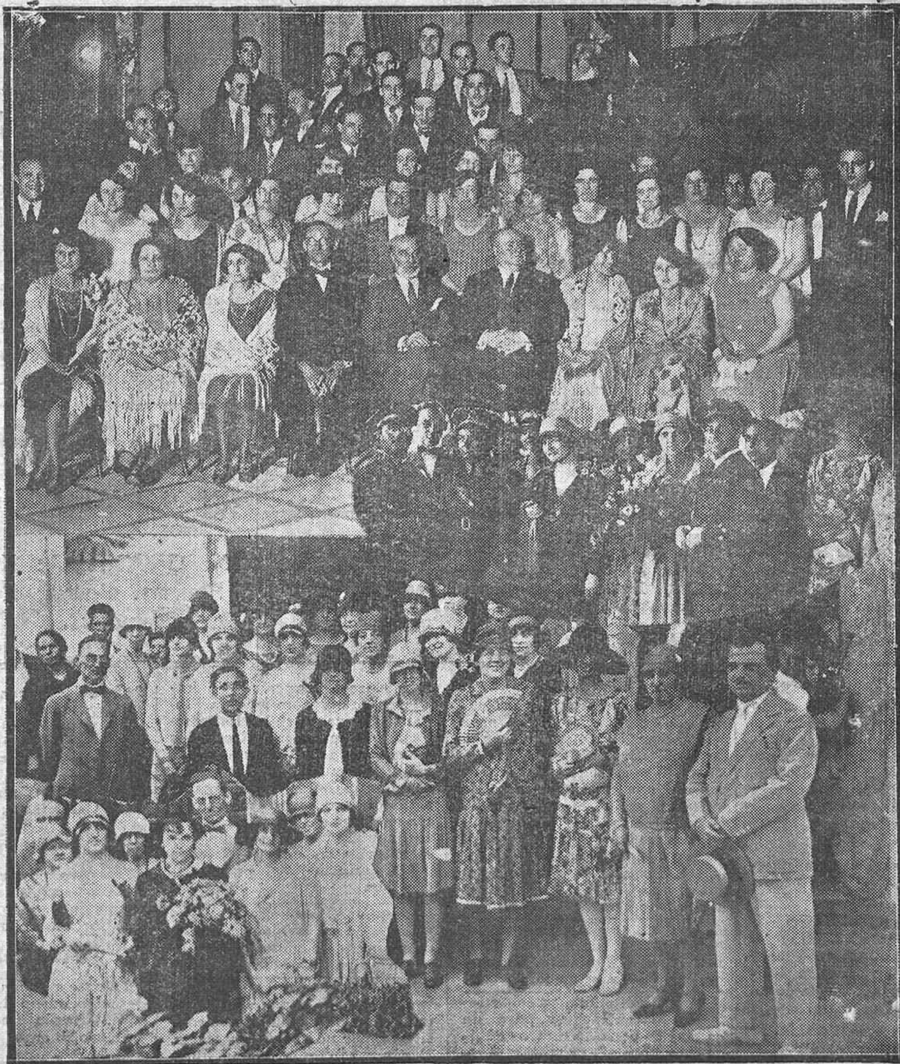
ESTUDIANTES AMERICANOS EN NUESTRA CAPITAL. — En el Círculo de la Amistad: El Gobernador civil con el presidente del Círculo y las alumnas del Instituto de las Españas en Nueva York en la verbera del sábado. — Varios aspectos de su excursión por Córdoba.