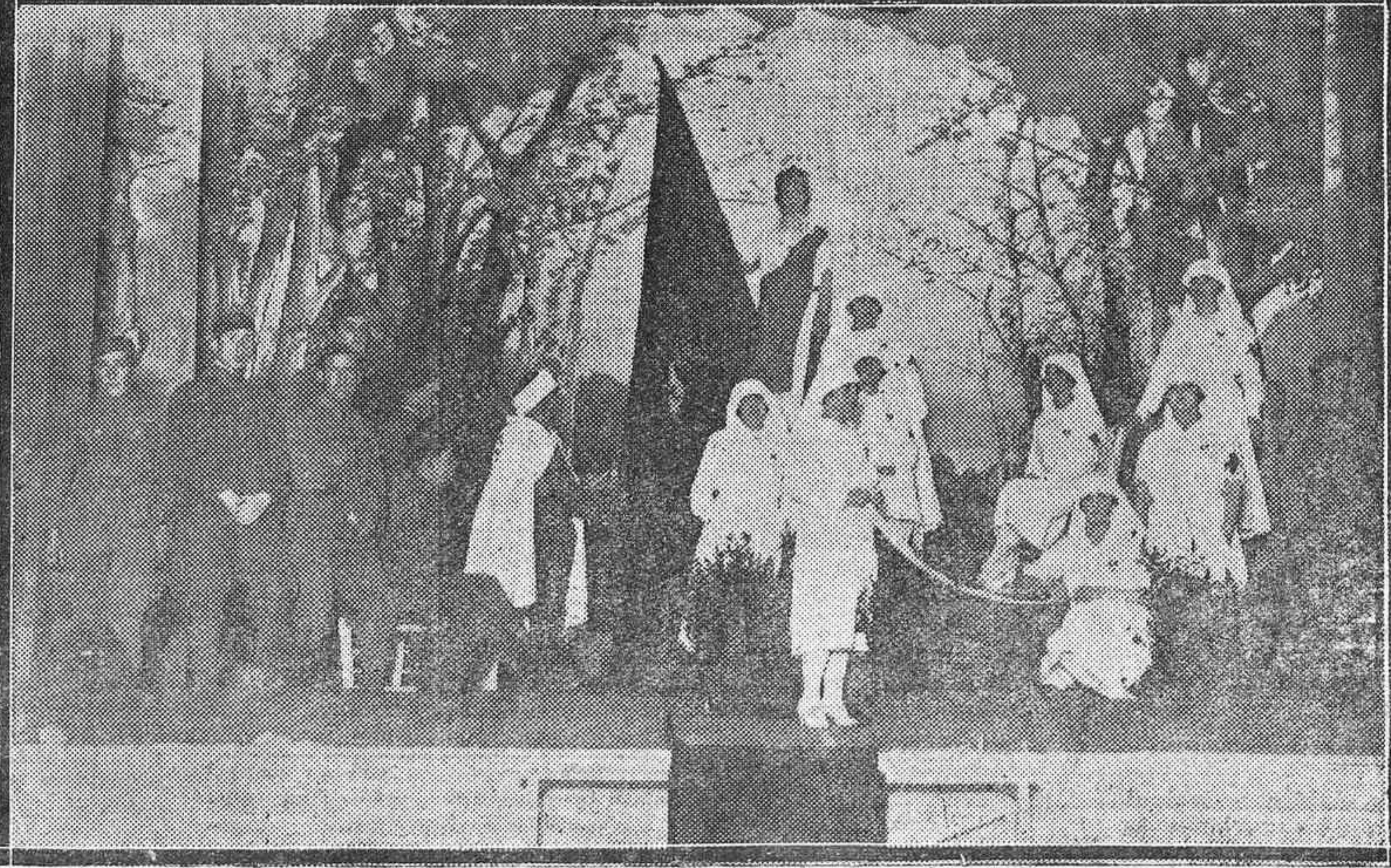
FIESTAS CATEQUISTAS.—Reparto de premios a las obreras que asisten a las clases por las distinguidas damas y autoridades.—Cuadro plástico representando la excelencia de la Cruz Roja.