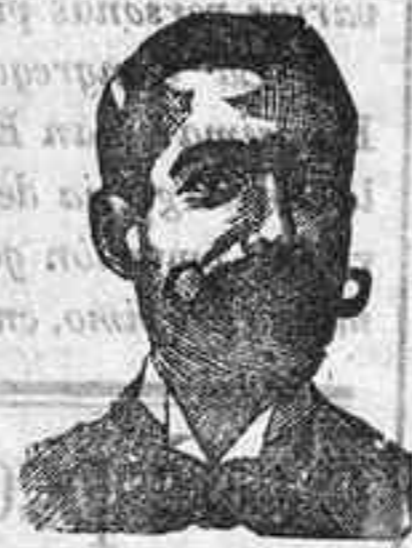
Inventor de los renombrados medicamentos COSTANZI

Estos exquisitos Chocolates de confianza están de venta en esta capital en todos los principales establecimientos de ultramarinos y Comestibles. No dejar de comprarlos en los mismos.