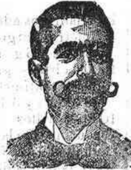
Inventor de los renombrados medicamentos COSTANZI

De venta en farmacias y droguerías. Se facilitan prospectos y folletos, Almagra, 30.—Córdoba.