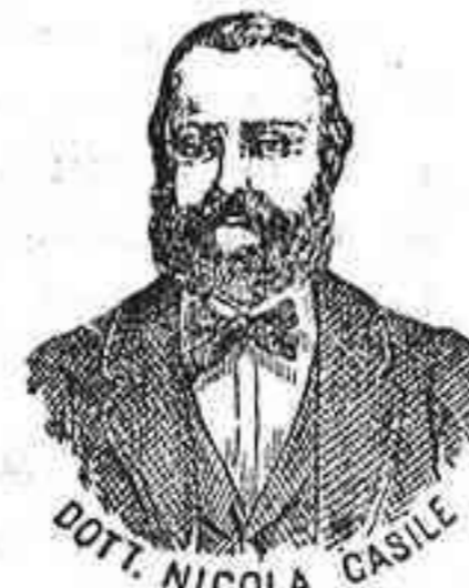
Invencor de los renombrados medicamentos CASILE

De venta en farmacias y droguerías. Se facilitan prospectos y folletos, Almagra, 30.—Córdoba.