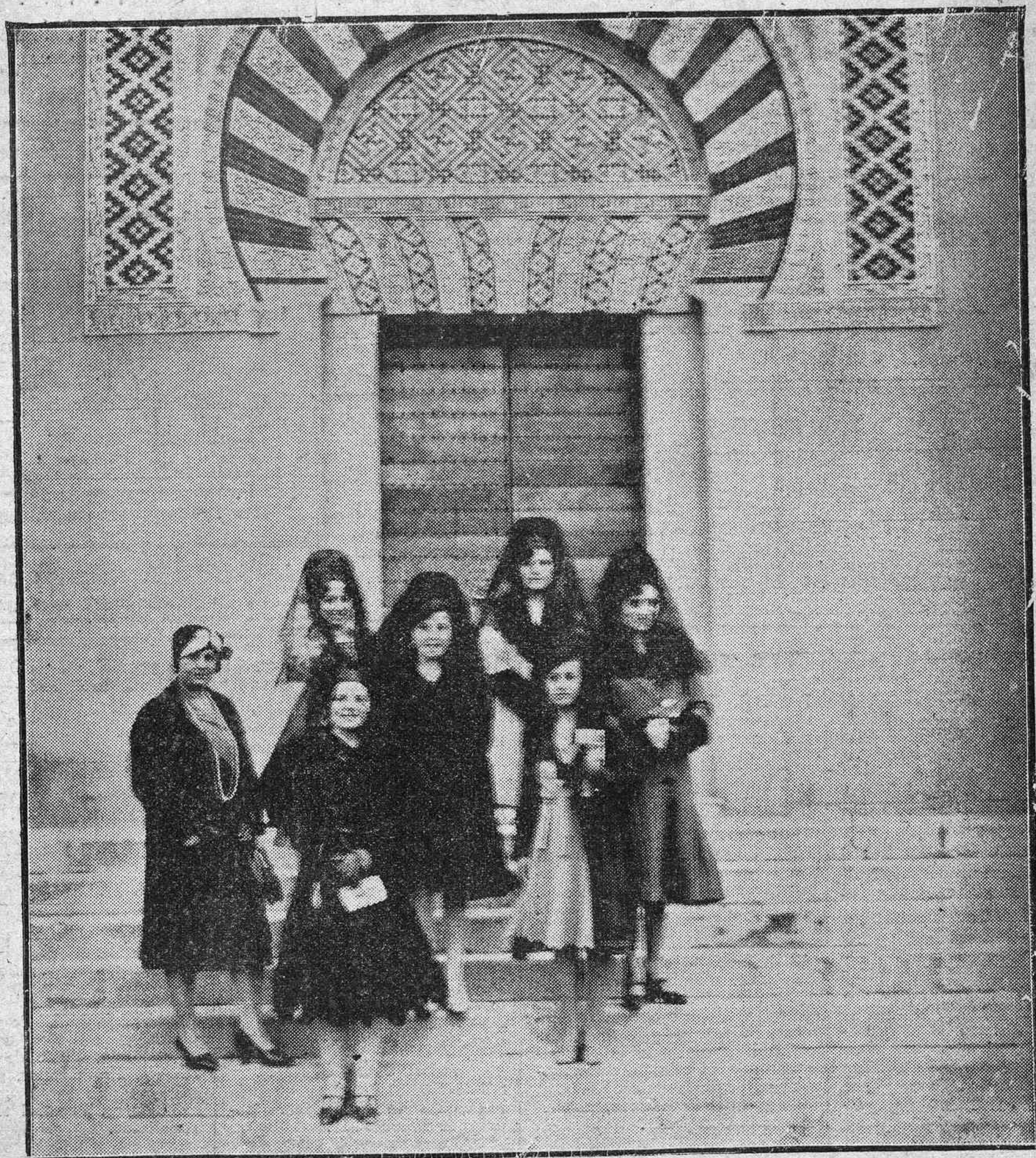
EXCURSIONISTAS EXTREMEÑAS EN CORDOBA.—SEÑORITAS PRESIDENTAS DE LAS ASOCIACIONES RELIGIOSAS DE FUENTE DEL CANTO (BADAJOZ) QUE ACABAN DE LLEGAR A NUESTRA CAPITAL, EN VIAJE POR EUROPA.