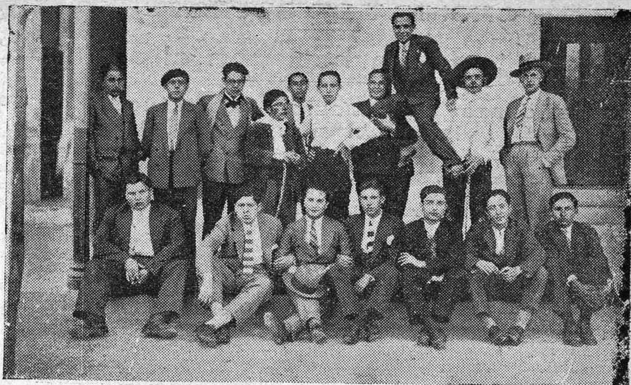
LA VELADA DE ANOCHE — JÓVENES QUE TOMARON PARTE EN LA VELADA LITERARIO MUSICAL CELEBRADA EN EL TEATRO DE LOS SALESIANOS.