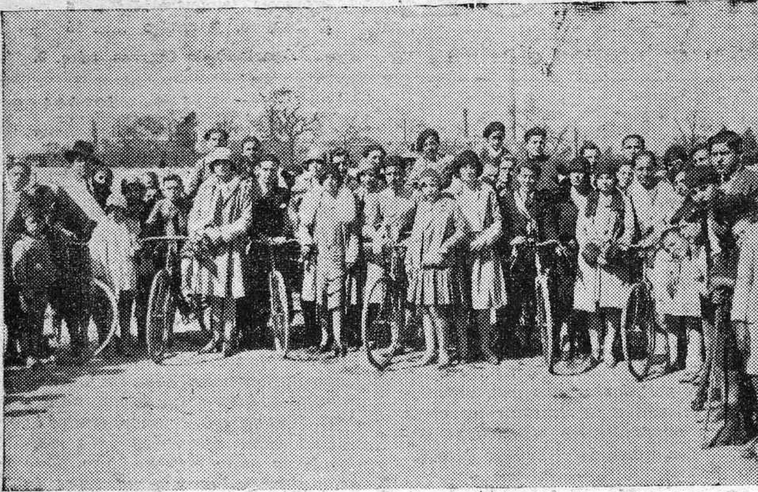
CARRERAS DE CINTAS.—LOS CORREDORES QUE AYER GANARON LA CARRERA DE HONOR.