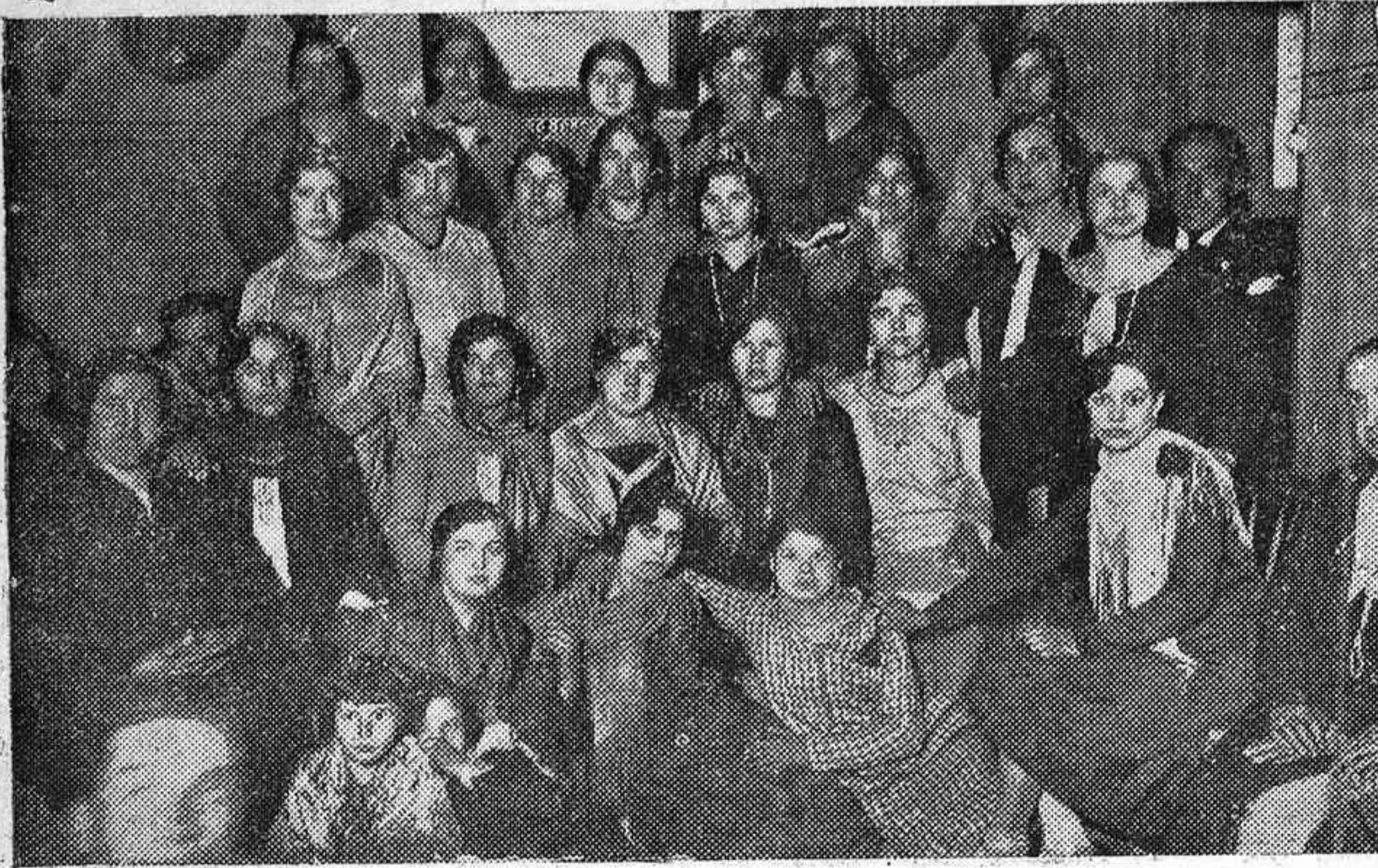
NOTAS DE CARNAVAL.—UN GRUPO DE ASISTENTES A LOS BAILES DE LA UNIÓN MERCANTIL RECREATIVA.