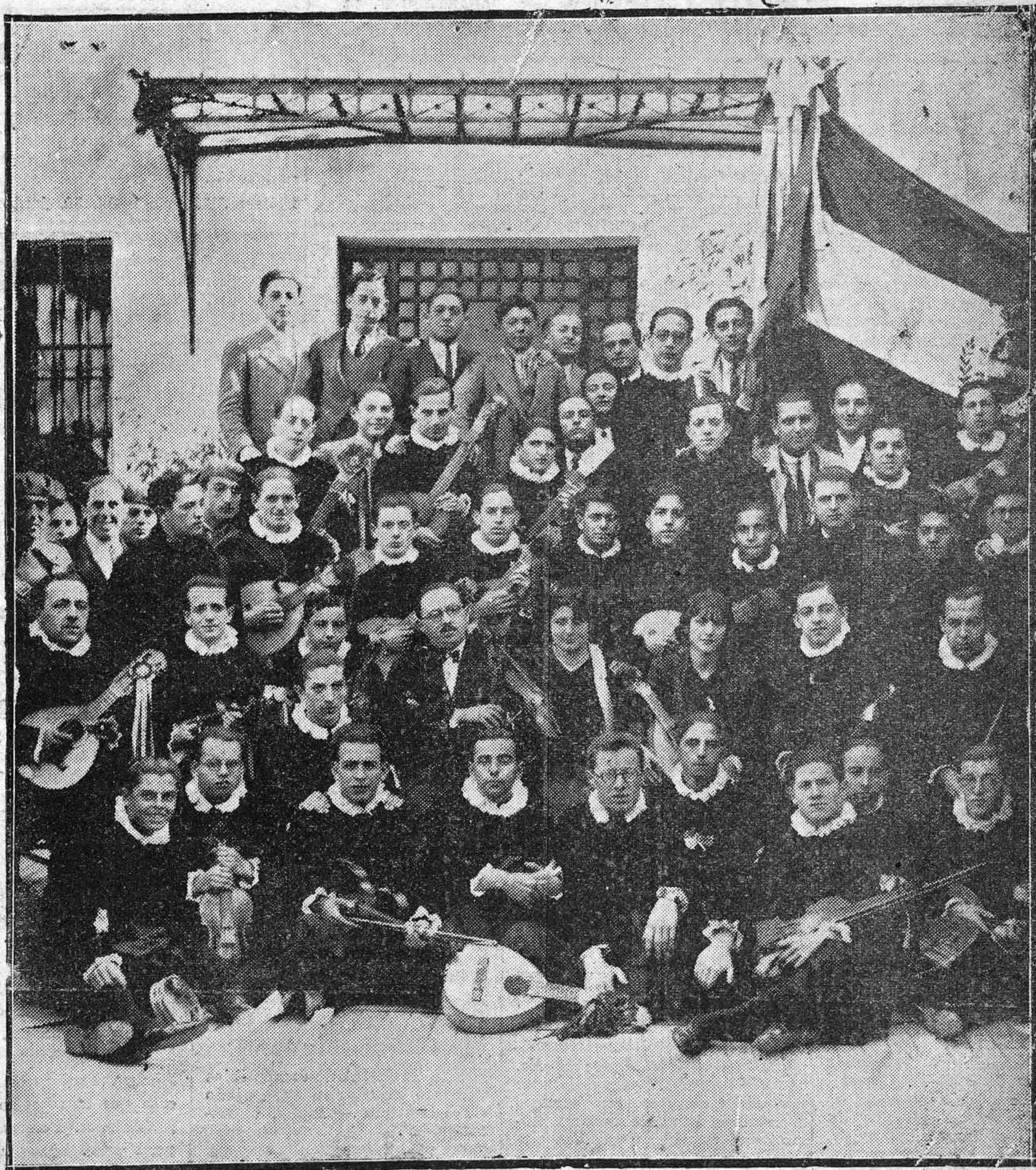
LA TUNA ESCOLAR GADITANA, QUE DURANTE EL CARNAVAL HA DADO EN CÓRDOBA VARIOS CONCIERTOS