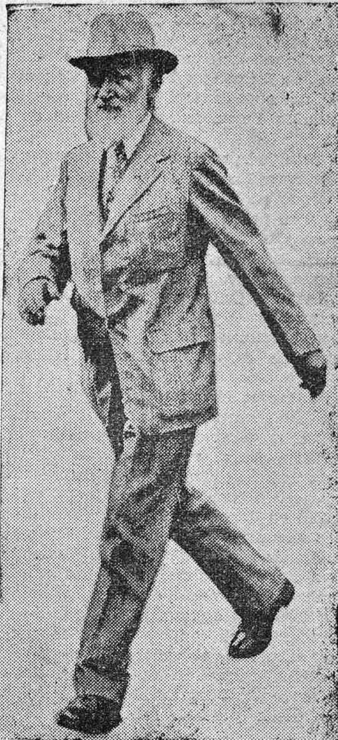
GEORGE BERNARD SHAW, EL GRAN DRAMATURGO, DURANTE SU HABITUAL PASEO MATUTINO POR LAS CALLES DE LONDRES.