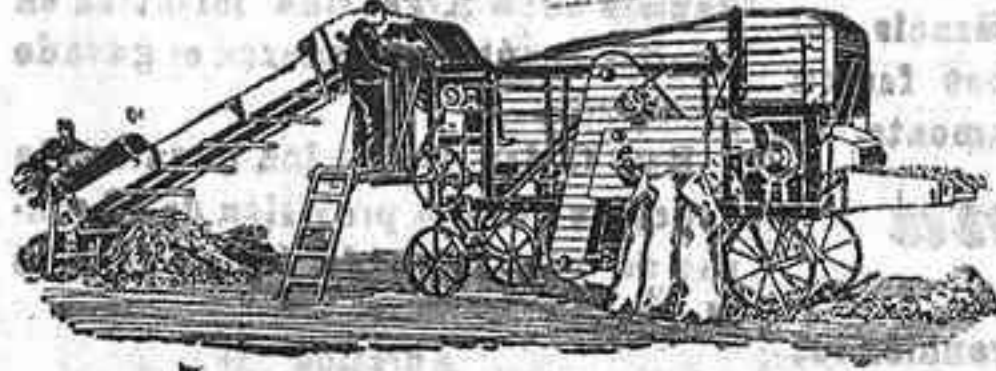
Trilladora Triunfo chica

Para labores grandes: Trilladoras Lanz de 4½ y 5 pies de ancho con locomóviles de igual marca. Rendimiento diario de 42 á 46 y de 50 á 55 carretadas.