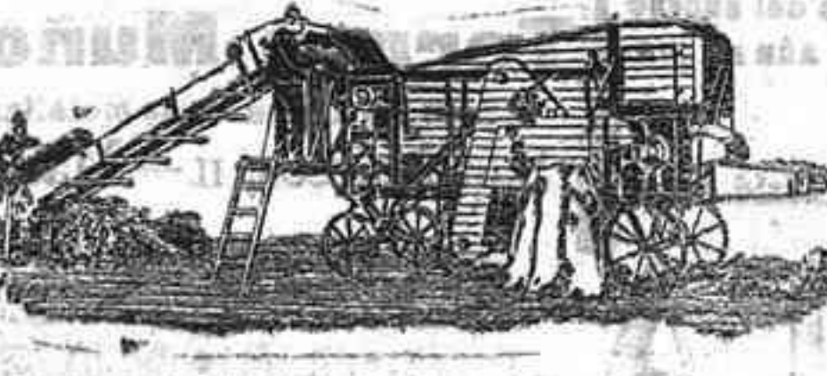
Trilladora Triunfo chica

Sucursal de Córdoba Conde del Robledo, núm. 1