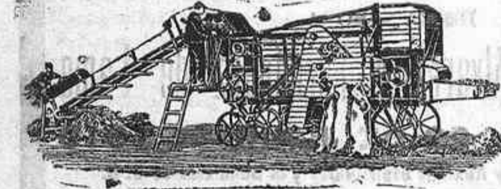
Trilladora Triunfo chica

Para labores grandes: Trilladoras Lanz de 4½ y 5 pies de ancho con locomóviles de igual marca. Rendimiento diario de 42 á 46 y de 50 á 55 carretadas.