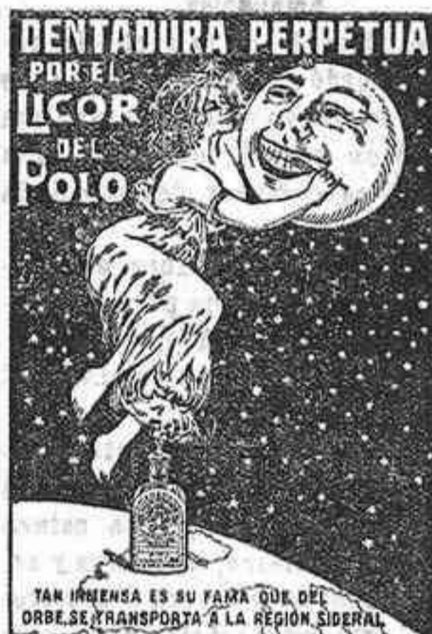
TAN INGENUA ES SU FAMA QUE DEL OMBRE SE TRANSPORTA Á LA REGION IBERICA

— SE SOLICITA UN BUEN REPRESENTANTE PARA ESTA REGION —