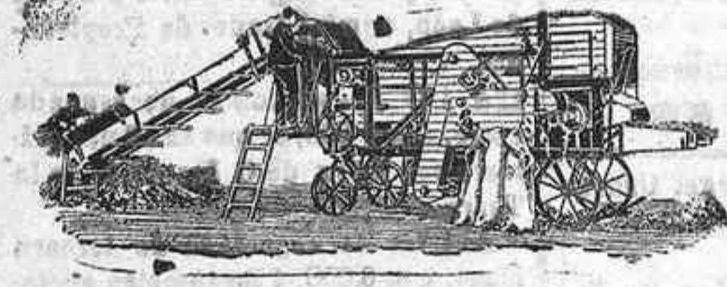
Trilladora Triunfo chica