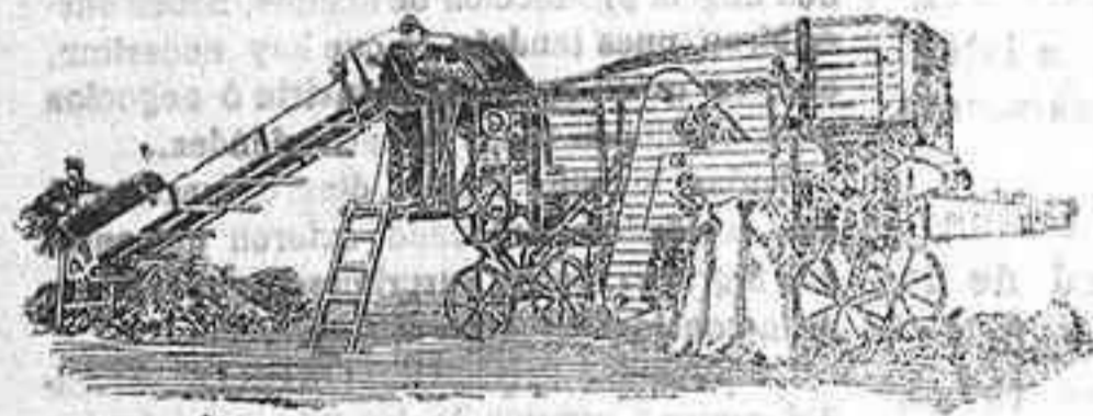
Trilladora Triunfo chica