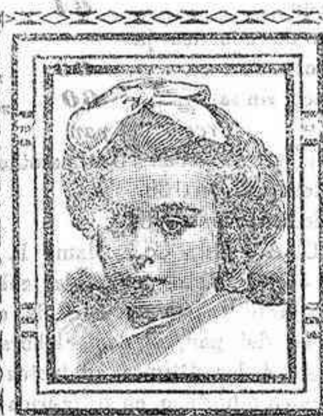
Barcelona, 11 Febrero 1908.

Ampliando la extensa información telegráfica que publicamos anoche, no-