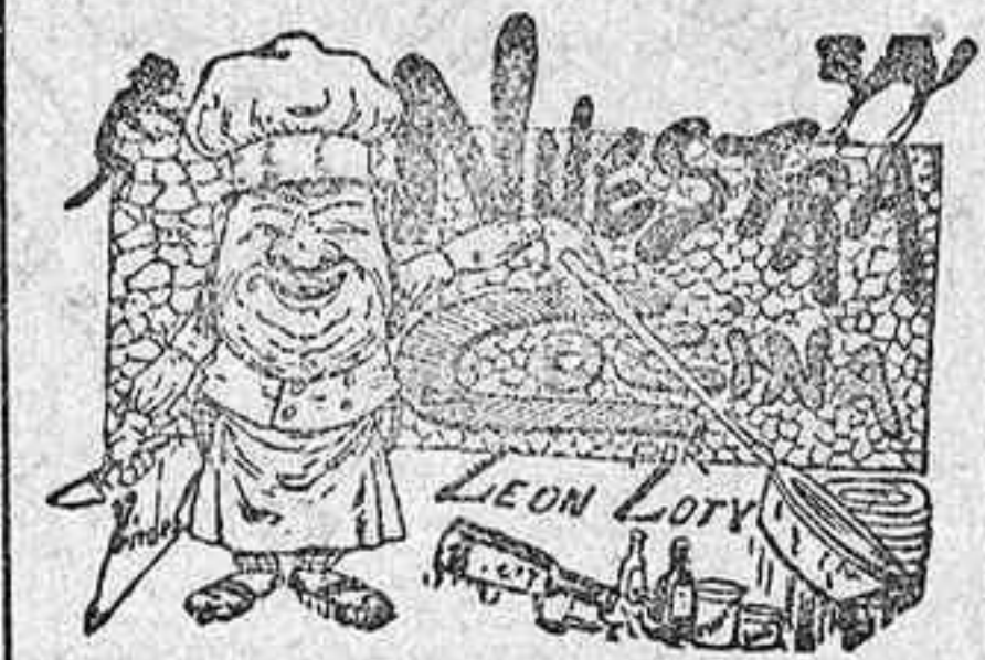
Comidas para el 3 de Noviembre

Las misas que se celebren el día tres de Noviembre en la capilla del Espíritu Santo, de la Santa Iglesia Catedral, serán aplicadas por el eterno descanso de las almas de los excelentes señores Condes de Gavia y Teniente general Conde de las Quemadas.