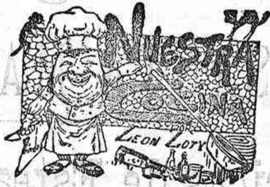
Comidas para el 5 de Octubre

—En el convento de la Encarnación se hará el ejercicio del mes del Rosario a las seis de la tarde.