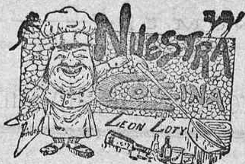
Comidas para el 12 de Mayo