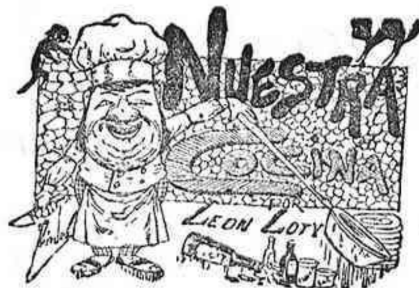
Comidas para el 2 de Marzo

En todas las iglesias parroquiales y en sus auxiliares se harán los piadosos ejercicios de cuaresma.