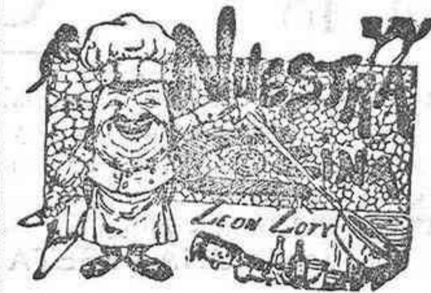
Comidas para el 27 de Octubre

Lo que se hace público por medio del presente para conocimiento de todos los cofrades á quienes se recomienda la asistencia.—Córdoba 23 de Octubre de 1901.—El Secretario.