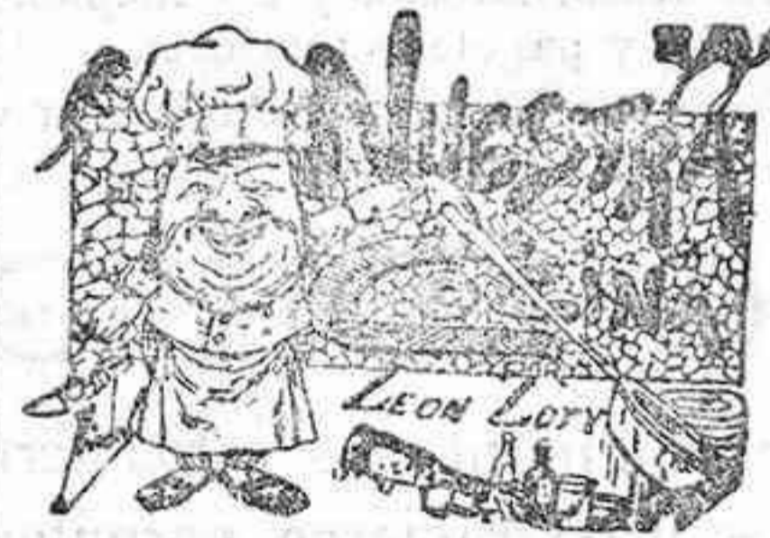
Comidas para el 29 de Septiembre

La Asociación de Nuestra Señora del Socorro tendrá mañana á las ocho, en la parroquia de San Pedro, la comunión general, y á las diez se verificará la solemne función religiosa, en la que tendrá á su cargo el pagnífico un Reverendo Padre del Inmaculado Corazón de María.