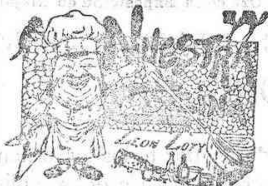
Comidas para el 17 de Agosto

En la playa. Dice la mujer á su marido: —¡No se ha visto nunca un mar tan tranquilo! El marido suspirando: —¡Probablemente será un mar soltero!