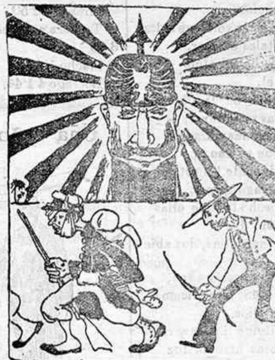
El Emperador Guillermo y Marruecos

La gran sombra. —(Animando á los soldados franceses y españoles). ¡Adelante muchachos, luego me tocará el turno!