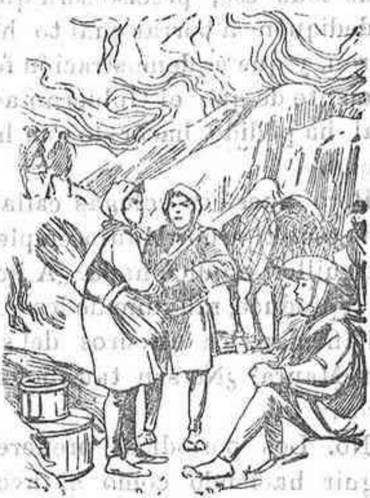
Soldados de la Administración Militar japonesa y coolies que sirven en las ambulancias siguiendo al ejército.