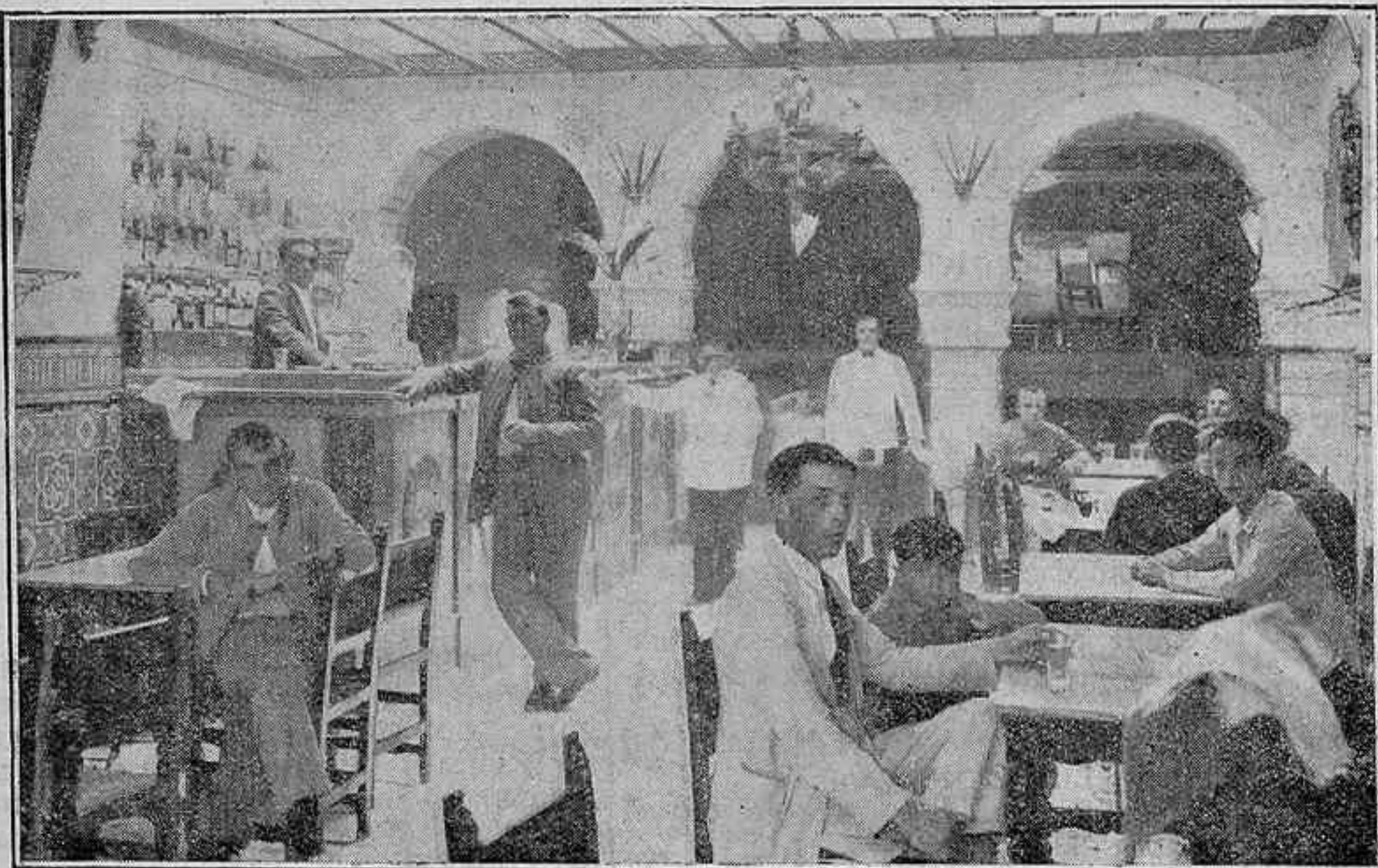
Un momento de tan singular Cruz del Campo, prez de Cabra