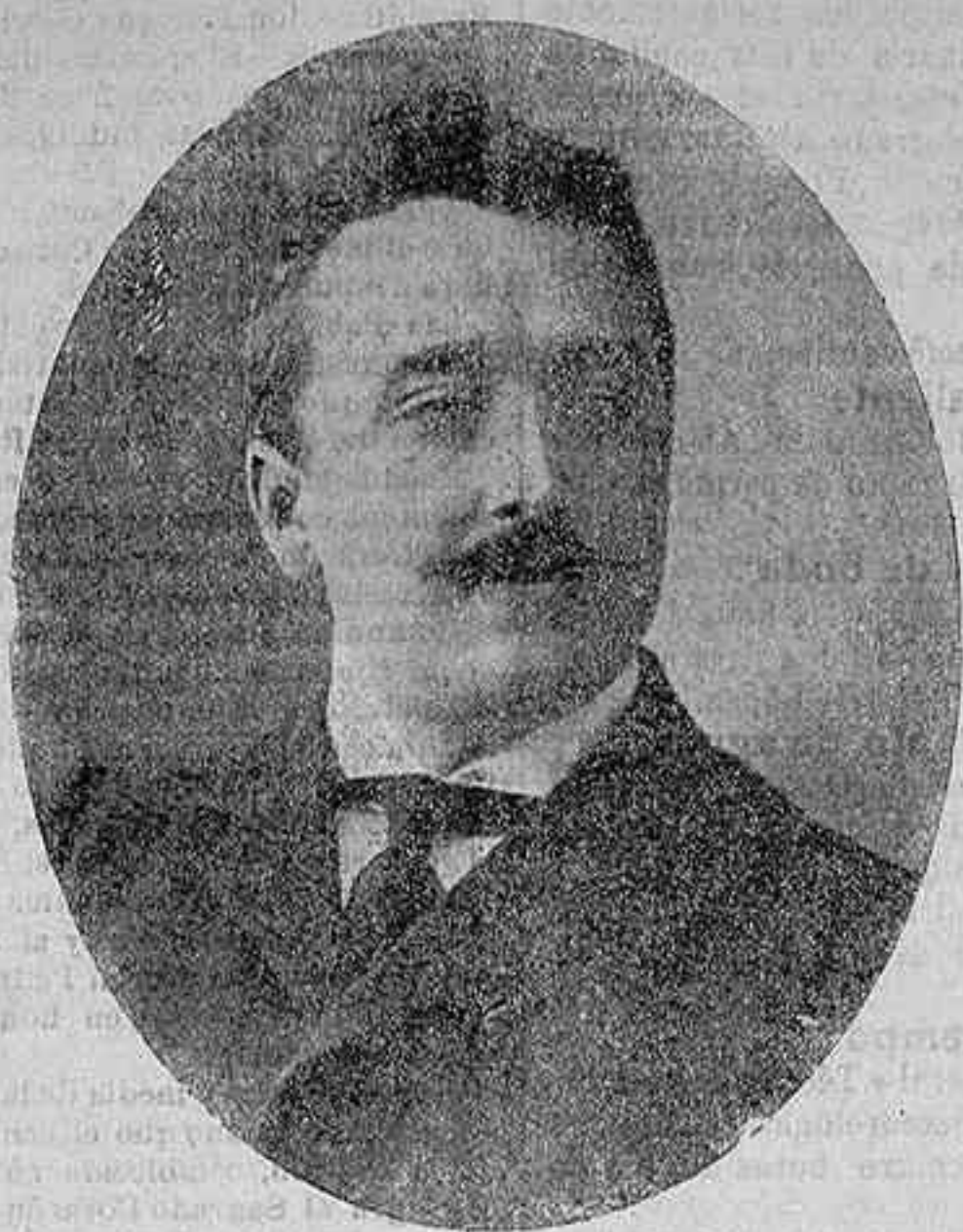
DON NICETO ALCALÁ ZAMORA.

Ilustre diputado cordobés que pronunció ayer en el Congreso un admirable discurso combatiendo el proyecto de las mancomunidades provinciales.