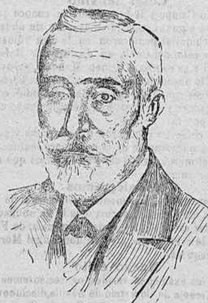
Don Antonio Maura, a quien en su última sesión la Academia de Bellas Artes de San Fernando ha elegido académico de número.