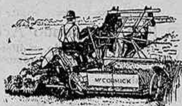
Afadoras Macormick — ULTIMA PERFECCION —