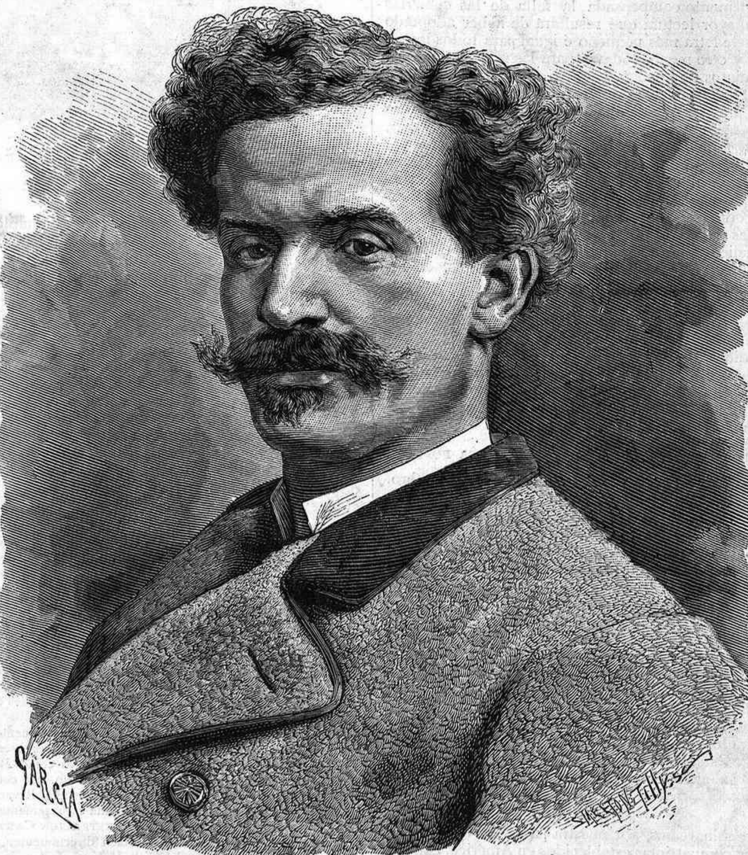
D. IGNACIO LEON Y ESCOSURA (Pintor asturiano.)

Confesamos, sin embargo, que esta obra de patriotismo no sería completa, si no tratásemos de extenderla á algo más. Los pueblos todos de la antigua Cantabria, unos por el origen y por la historia como lo son por la tierra que ocupan, pueden entrar perfectamente en la especial confederacion que iniciamos, y bajo la cual caben, como decimos, y con sobrada holgura, los que ya en otros tiempos estuvieron unidos por los estrechos lazos de una comun aspiracion, de una organizacion igual y de unas leyes que, áun despues de largas separaciones, se ve ser en el fondo unas mismas. Habiendo comprendido que, para lograr tanto, basta ponerlas en contacto y agruparlas bajo una bandera, no hemos vacilado en hacerlo así, áun á riesgo de tener que hacer nuevos sacrificios. Mas, si estos sacrificios fueron tales que nadie los desconoce; si se nos vió solos, y sin ayuda oficial de ningun género, dominar las dificultades que nos cercaron y realizar nuestras más caras aspiraciones, justo será que, al extender nuestra esfera de accion, al acometer mayor y más grave empresa, no se deje caer sobre nosotros únicamente el peso de todos los sacrificios, bastando los hechos ya para probar que no nos mueve en esta ocasion, sino el deseo de iniciar un verdadero movimiento de fraternidad entre los pue-