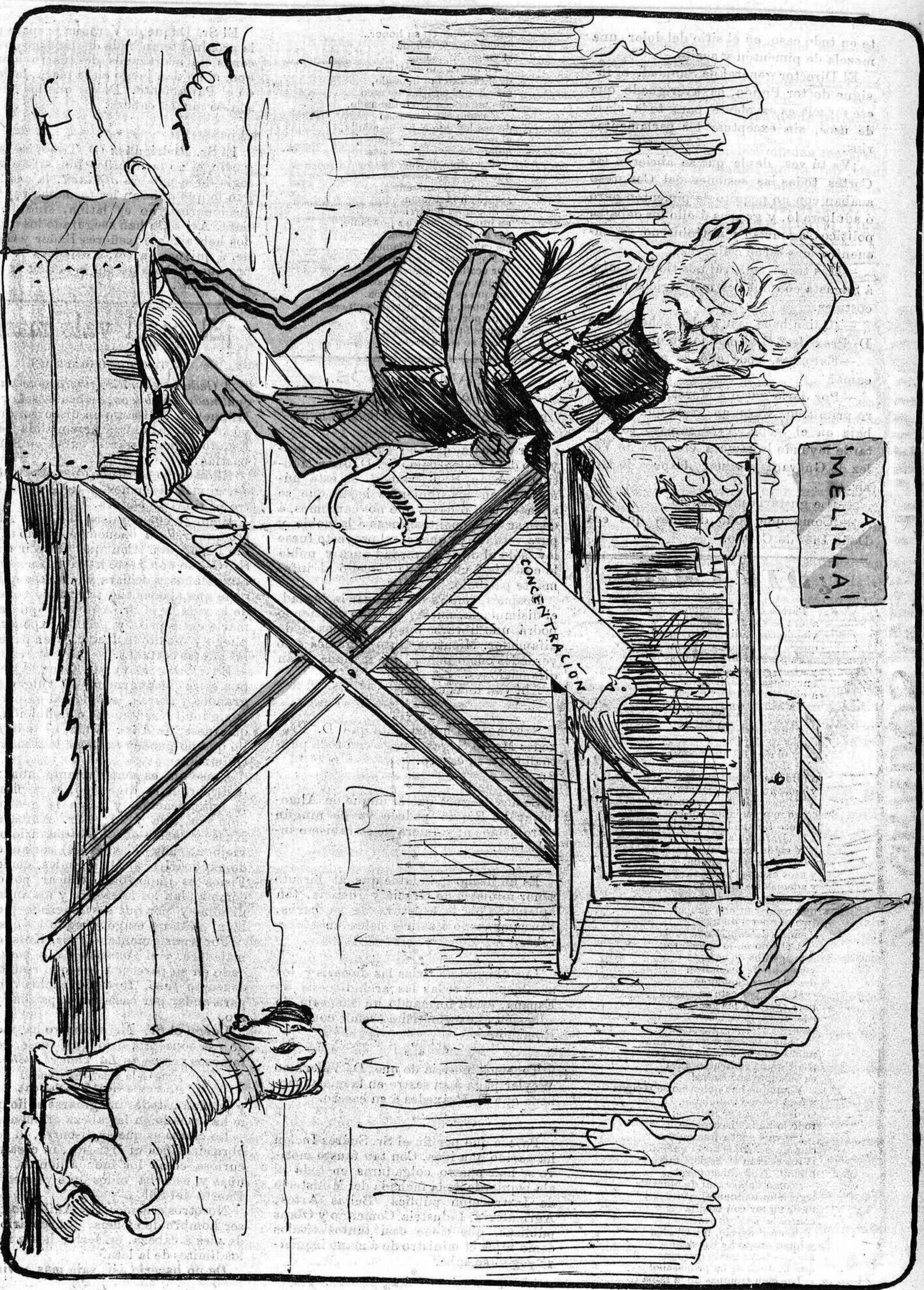
—Historia y suerte de las personas, sacada por los pajareros sabios! ¡Quién pide otra!