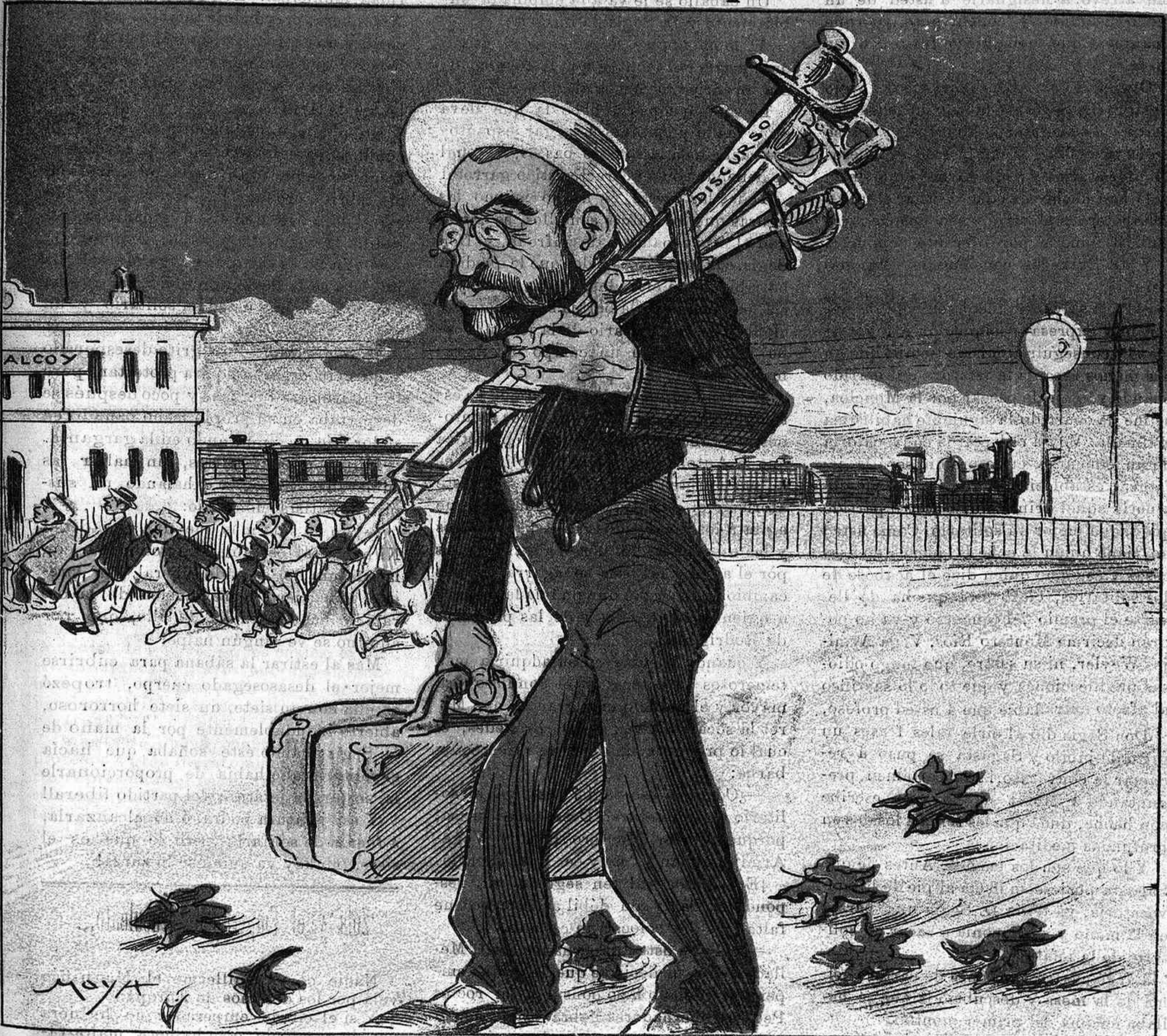
«El chico de la blusa prosigue toreando por provincias durante la temporada de otoño. Ayer, en Murcia, á beneficio Tiro Nacional, seis tiros, digo, seis toros, seis estocadas. Ovación y oreja.»