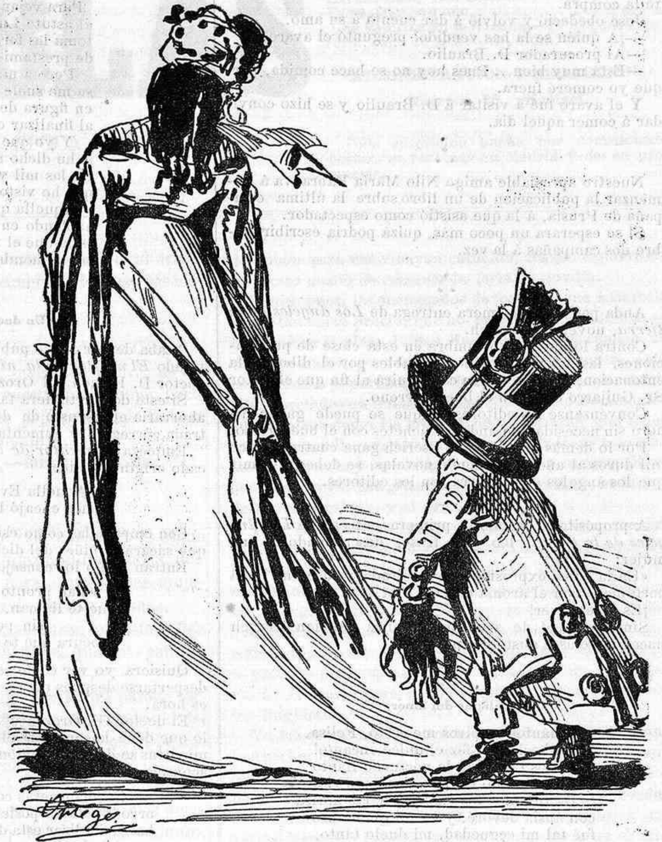
El paje en otro tiempo, ya distante, era, á la par que servidor, amante.