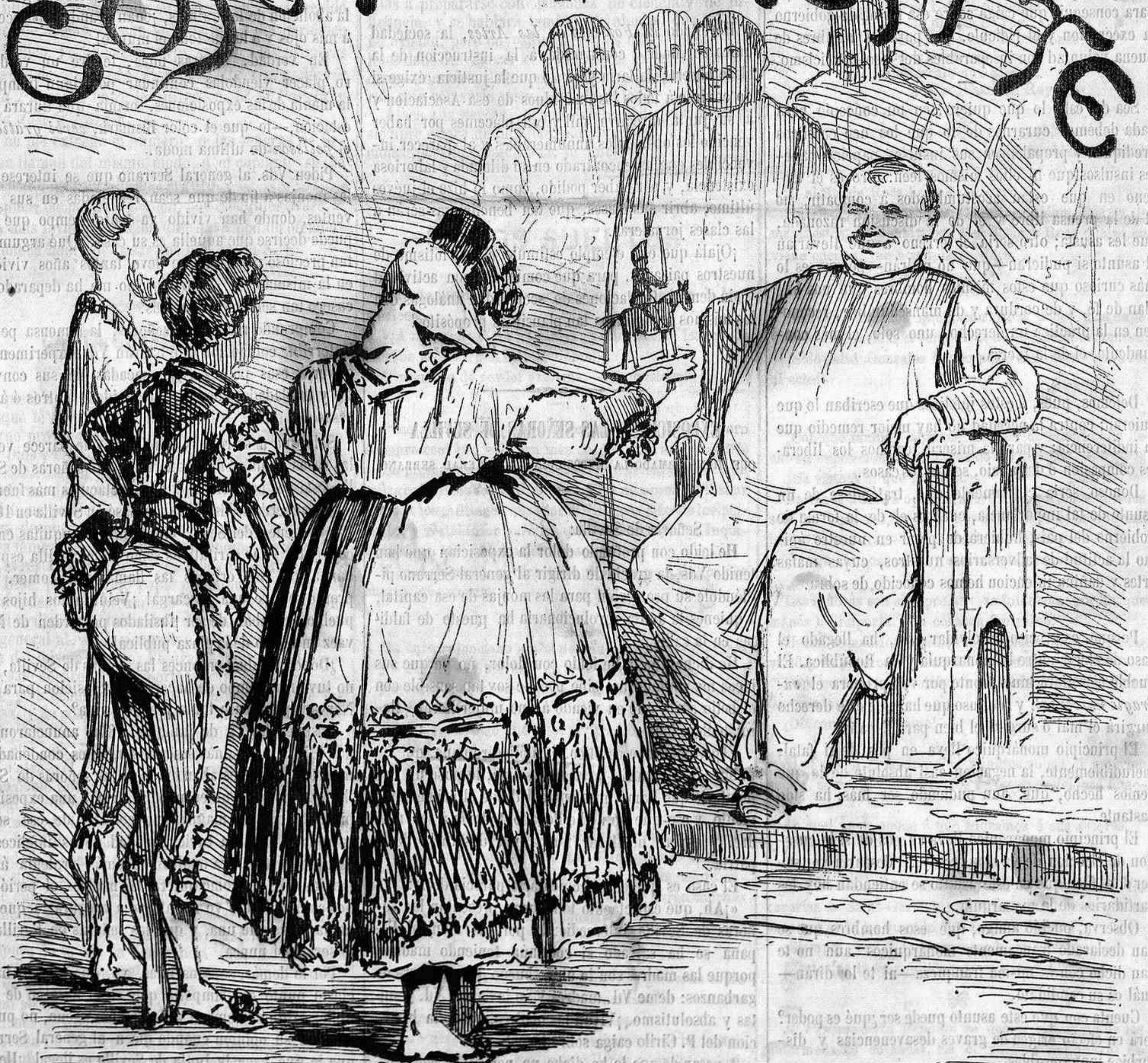
—Os habia ofrecido 30.000 hombres para defender el poder temporal. Os traigo el principe de Asturias, unico soldado que me queda.