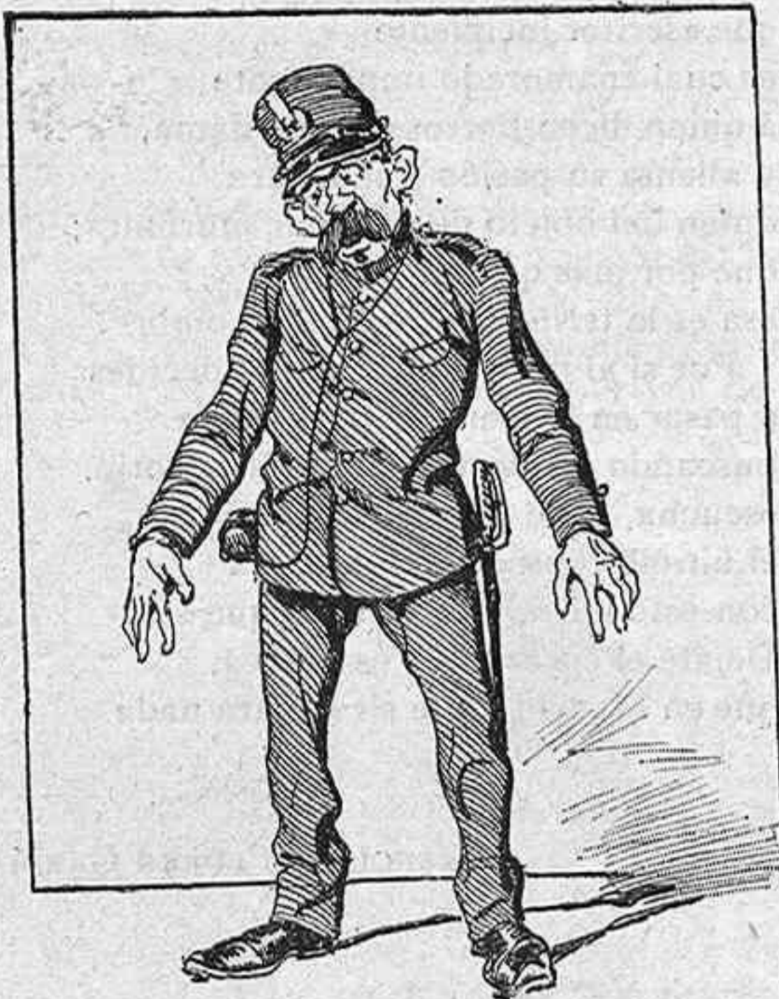
—Por donde quiera que fui, la razón atropellé...