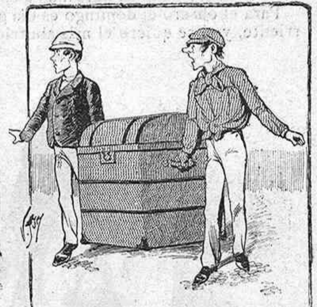
El mundo grande.