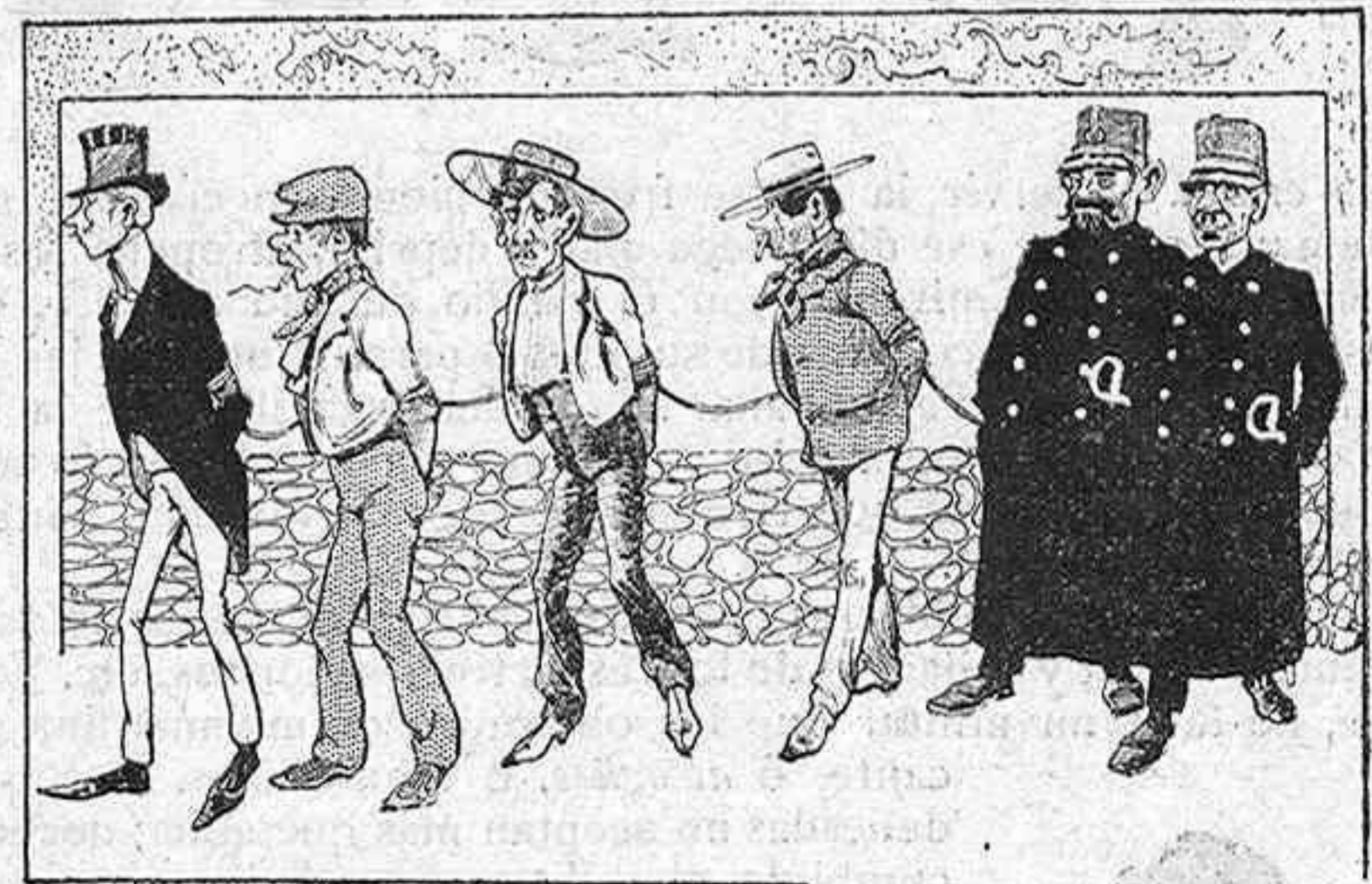
Una cuerda de mozos.