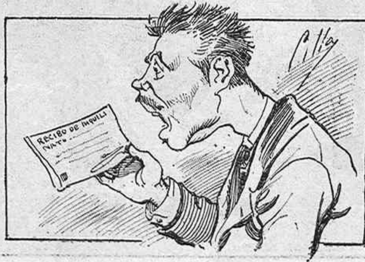
—¡Ah, qué filtro envenenado me das en este papell...