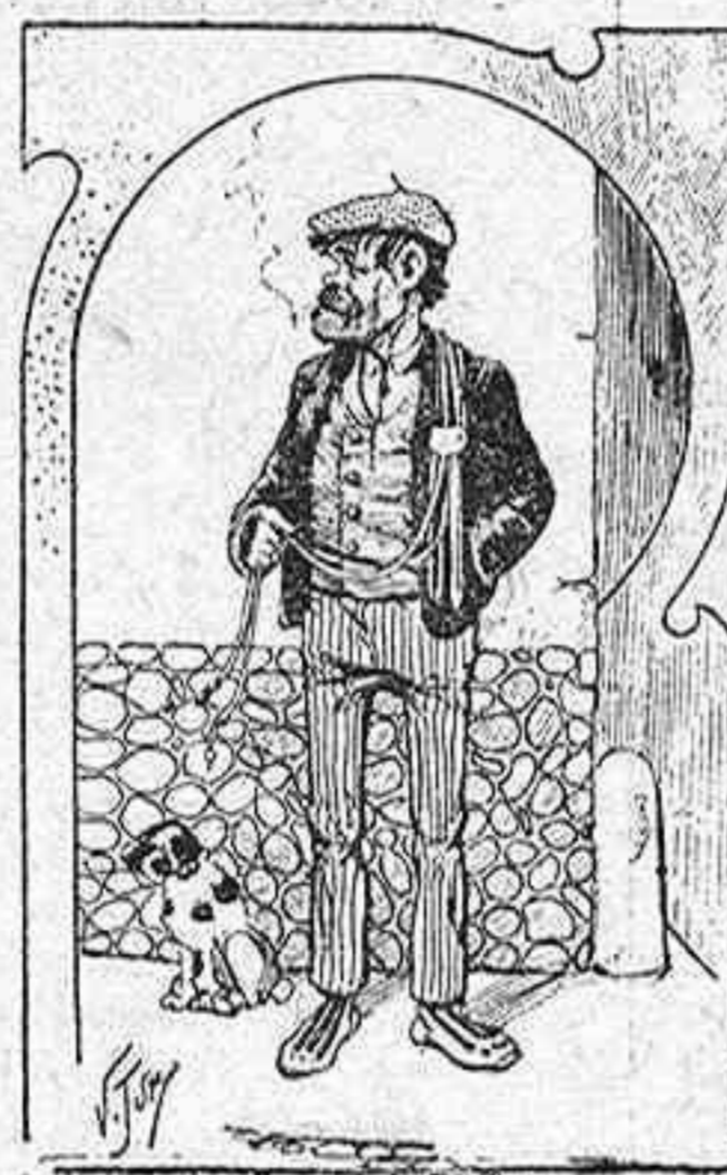
Un mozo de cuerda.