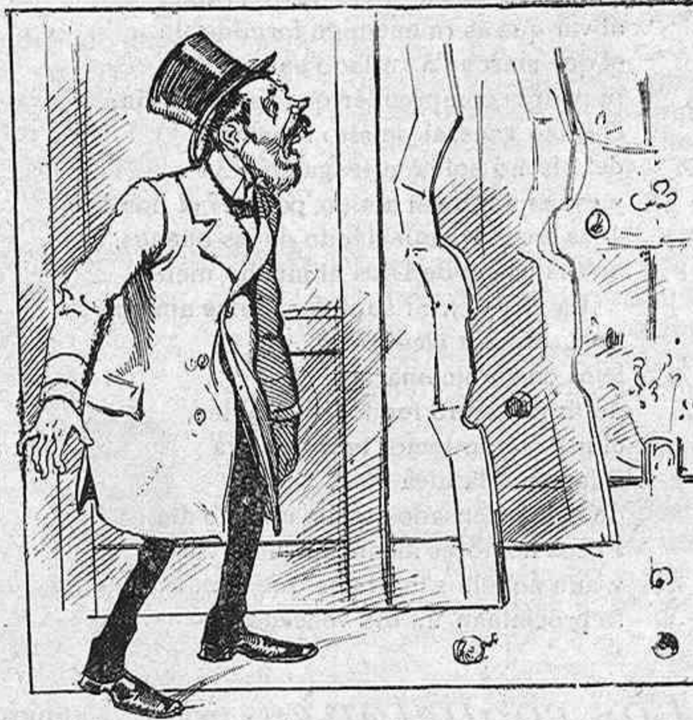
—¿Cual gritan esos malditos!