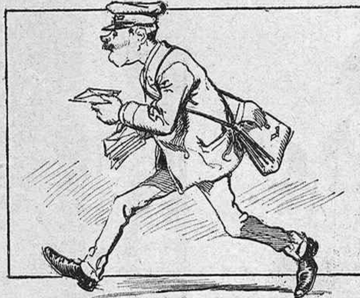
—Yo á los palacios subí, yo á las cabañas bajé...