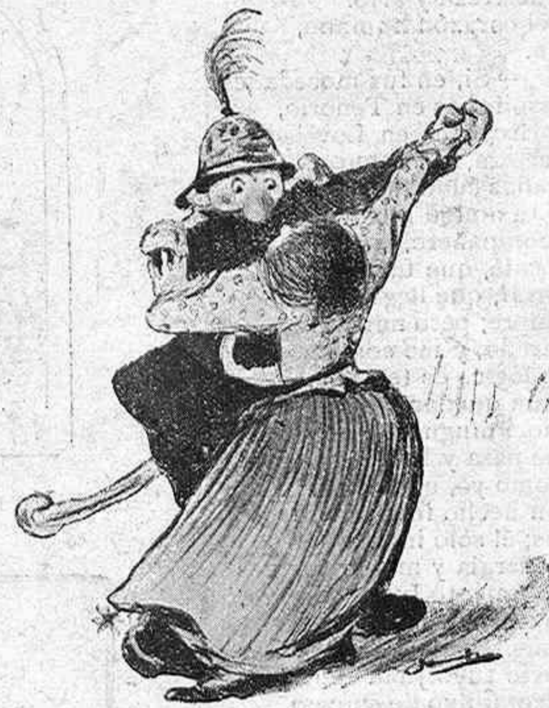
Ilustraciones de SANCHÁ.