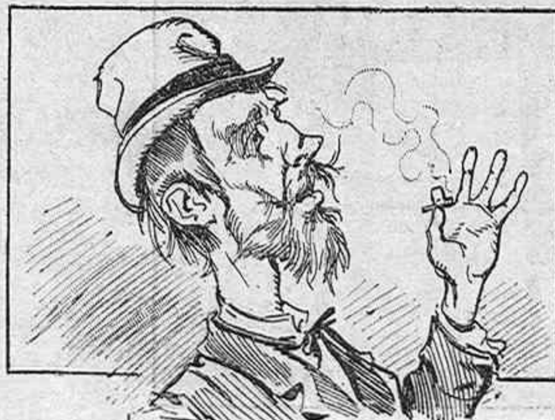
—Siempre vivió con grandeza, quien hecho á grandeza está.