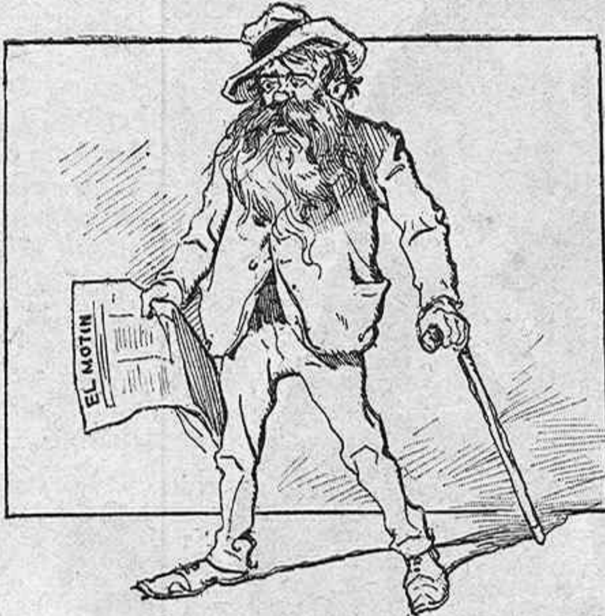
—Ni reconocí sagrado...