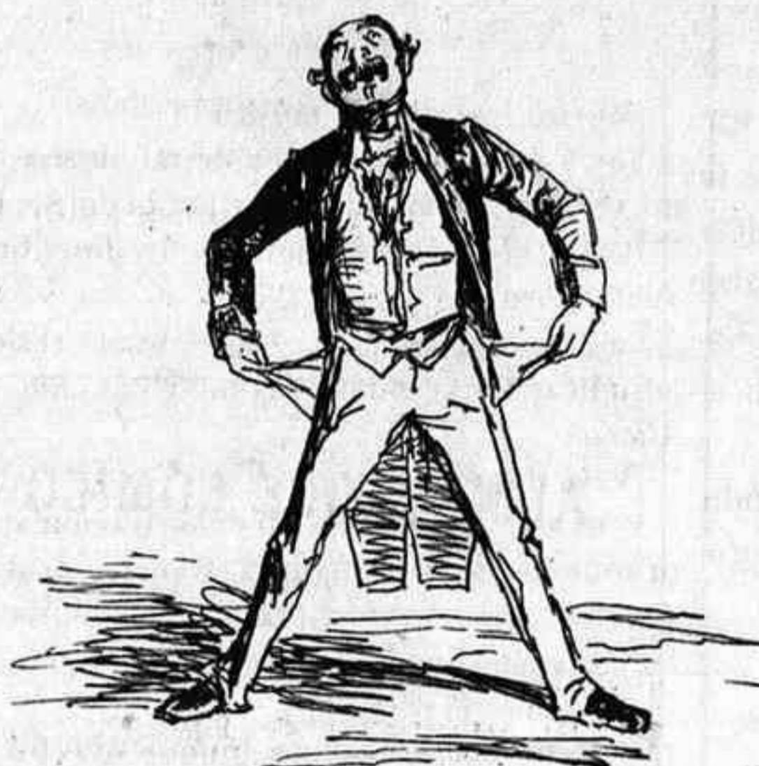
-El estado de la Hacienda es un poco climatérico.