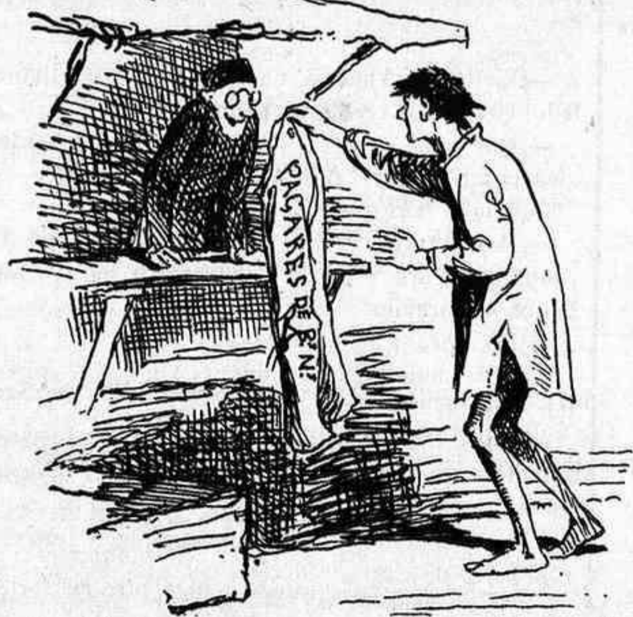
-Y utilizando la gran masa de Bienes Nacionales.