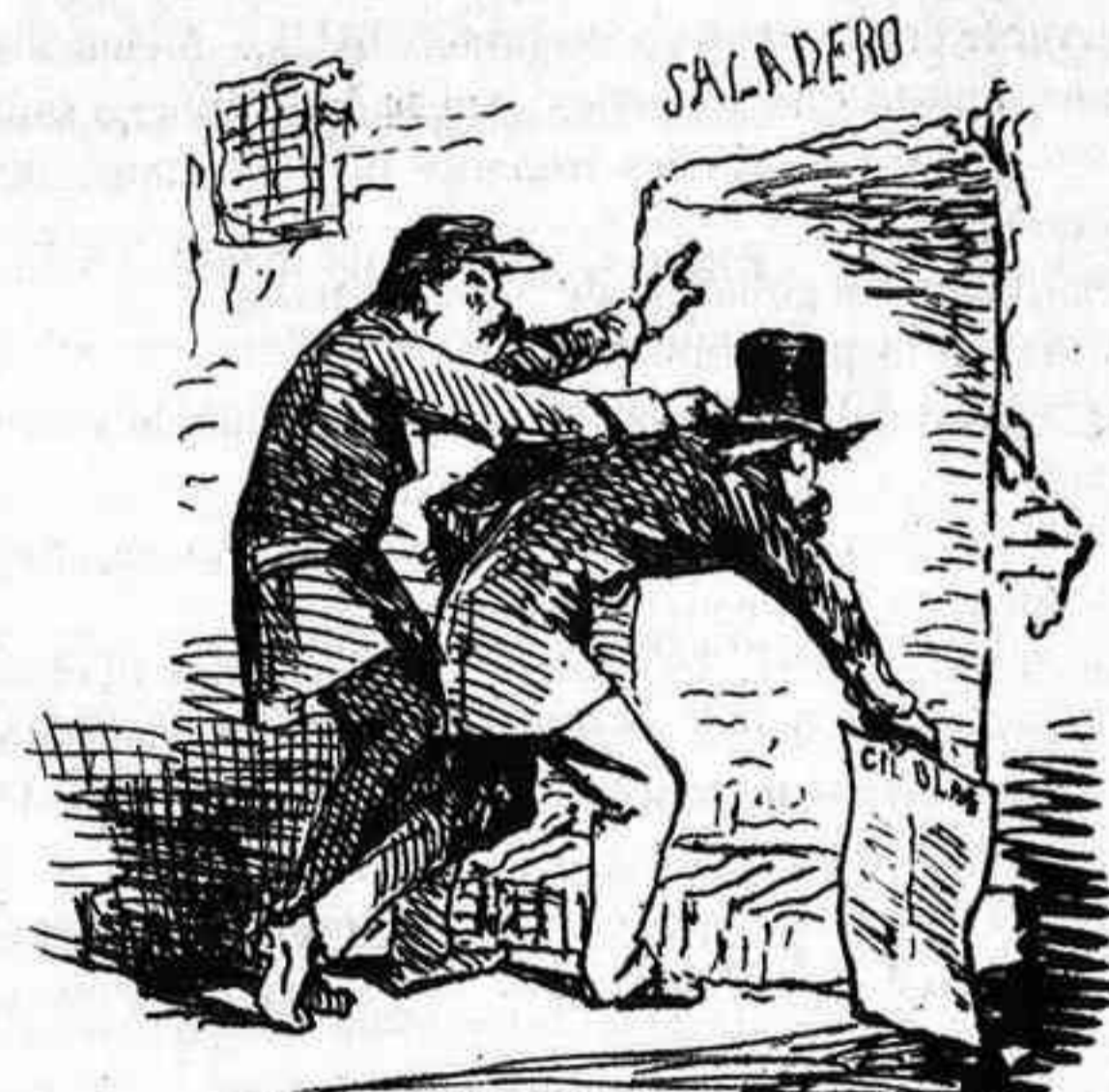
-Nuestra política tolerante sin ser servil.