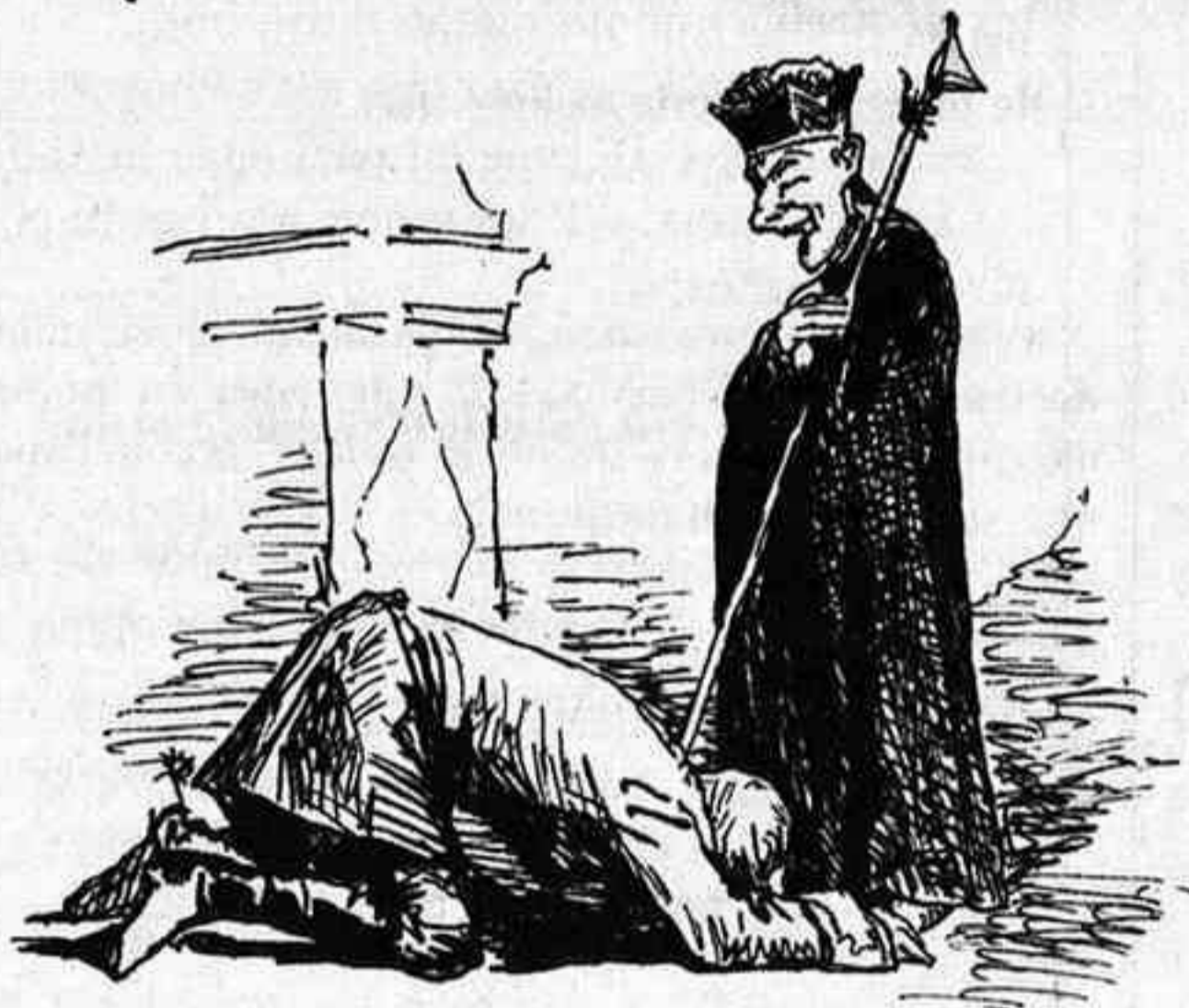
-Lo que no impide que hese el pie al primer sacristan que me salga al paso.