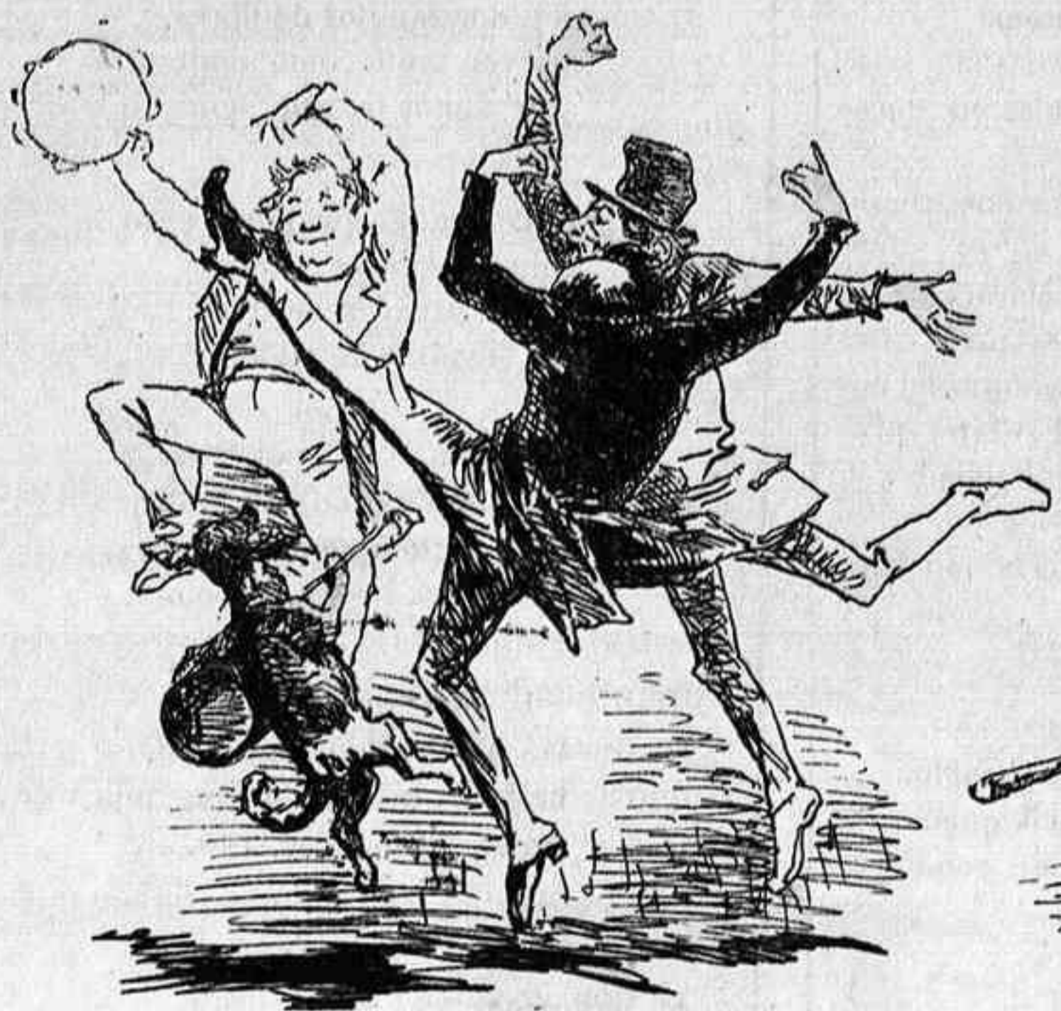
-La apertura de las Cortes es siempre un motivo de júbilo: sobre todo si se abren por Pascuas.