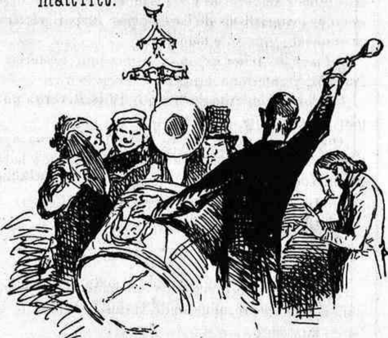
-Podremos si se hacen economías, convertir al país en una Jauja. ¡Musica, musica!