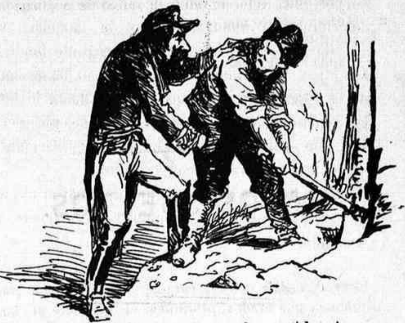
-Pero dándole una nueva forma a los impuestos que los haga mas productivos.