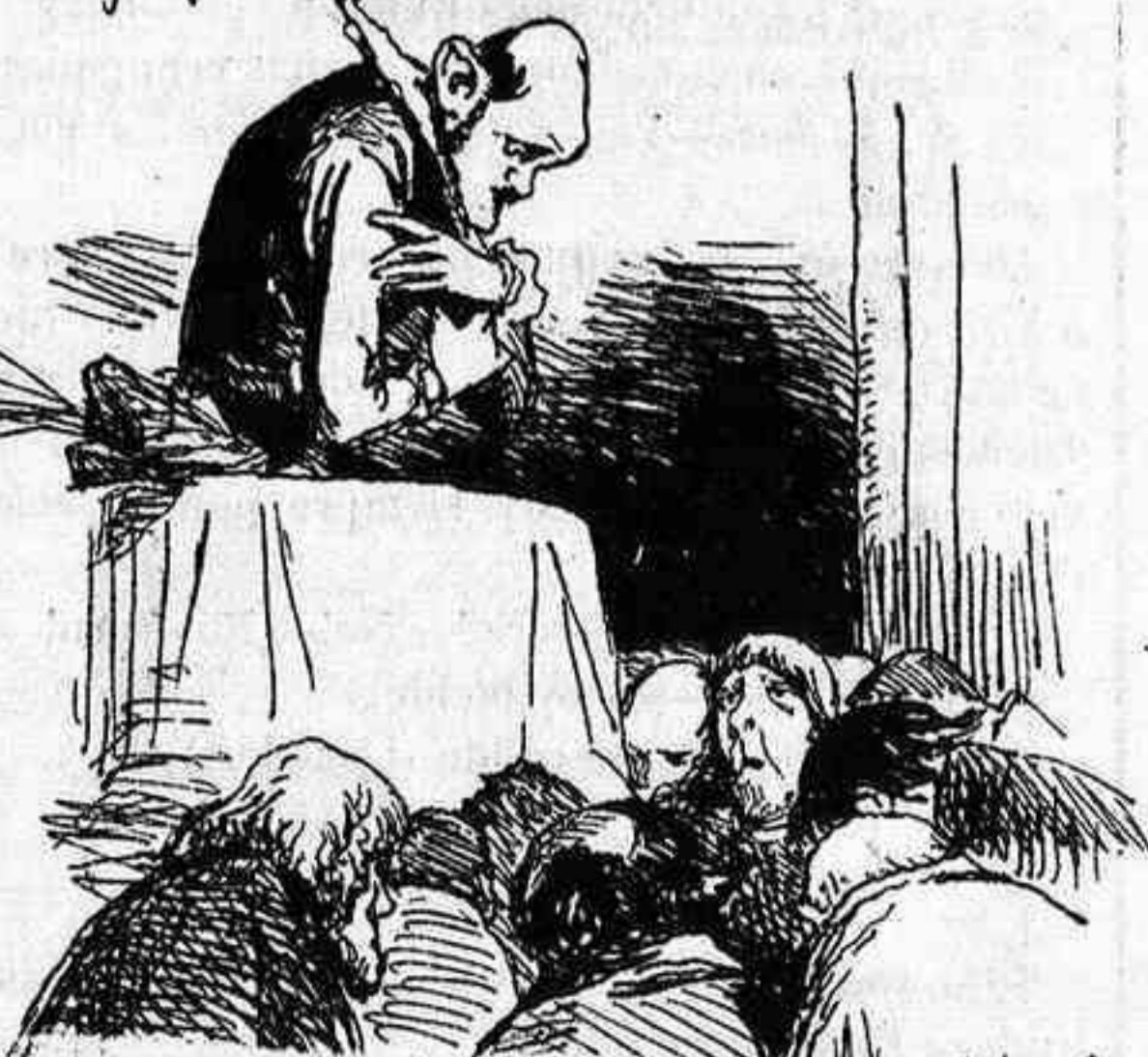
Ahora puesta la vista en Dios digamos con el Ángel amen.