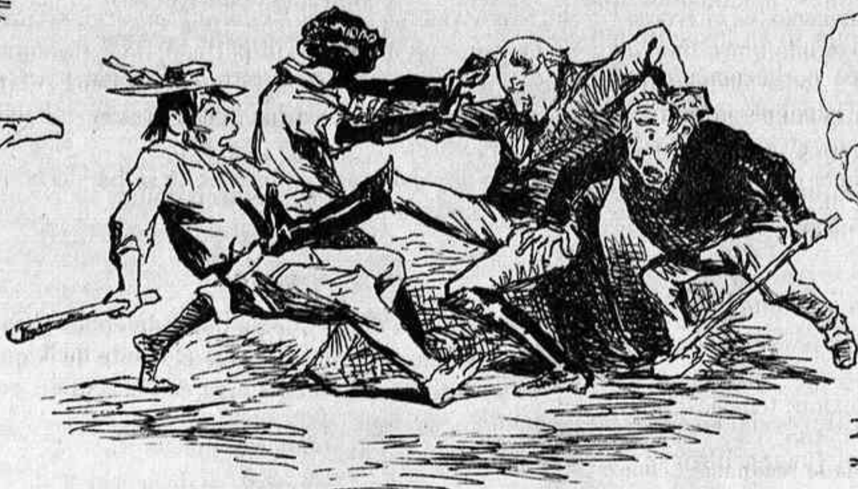
-Mi constante anhelo por la paz no ha sido inconveniente para que nos rompamos las cabezas con todo el mundo.