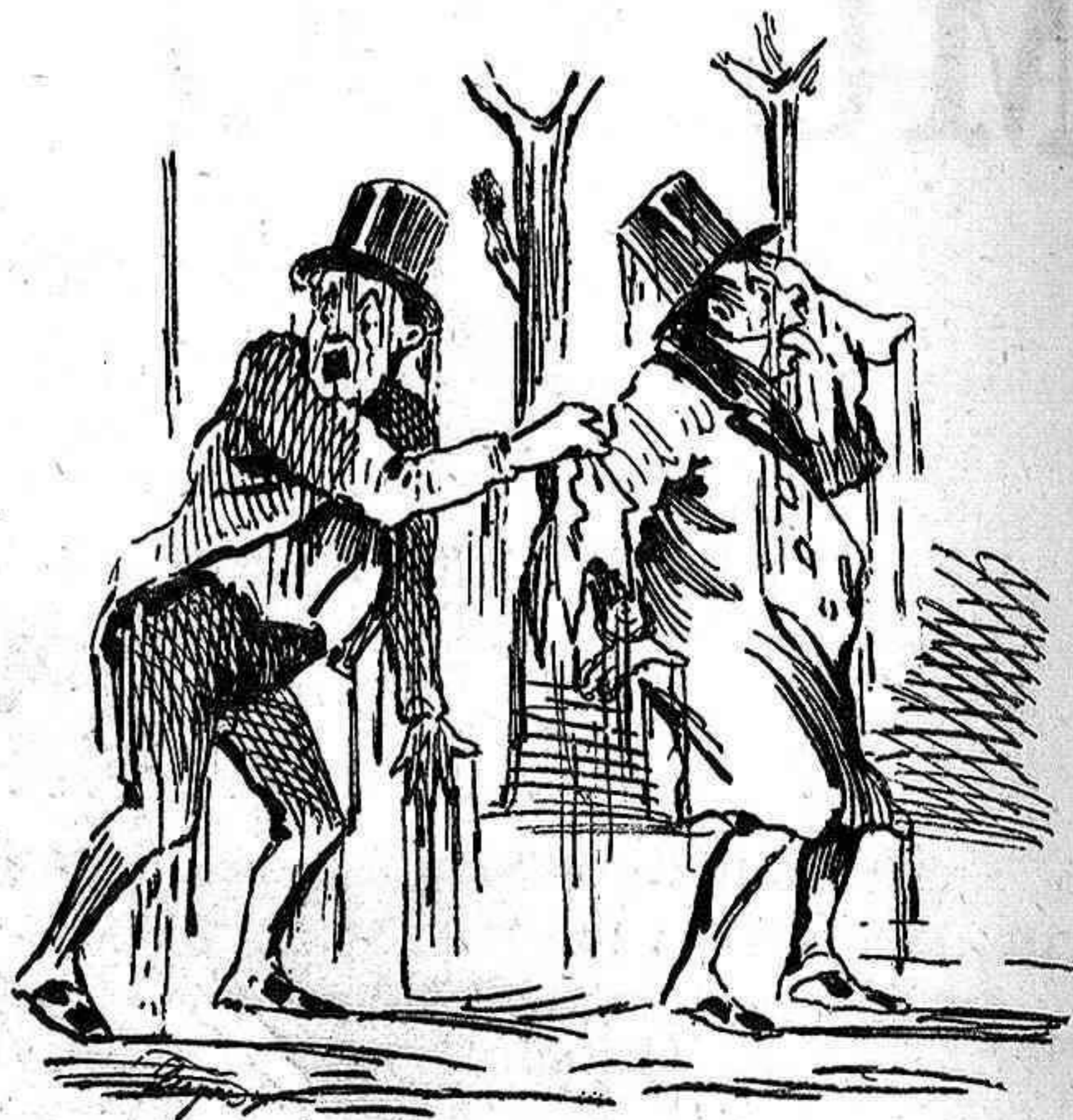
Hoy.—Sudando betun... hasta el sombrero.

—Entonces el santo cogió su cabeza, que acababa de cortar el verdugo, la besó y volvió á colocársela sobre los hombros.