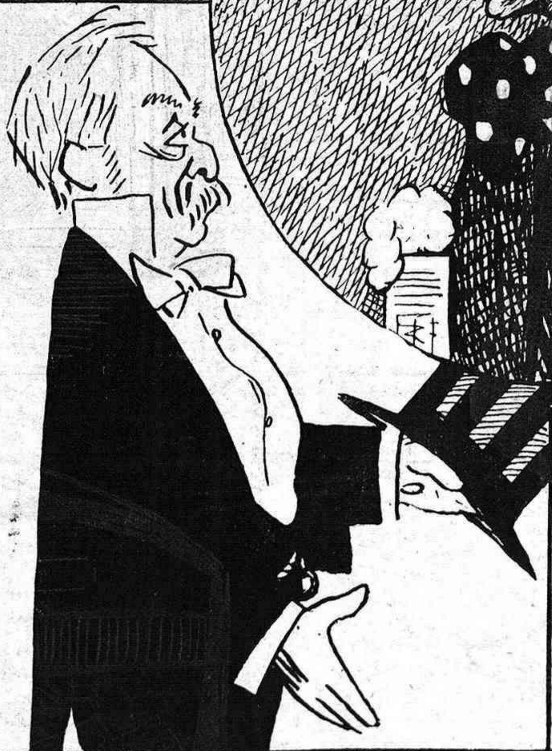
LA SOMBRA DEL PADRE