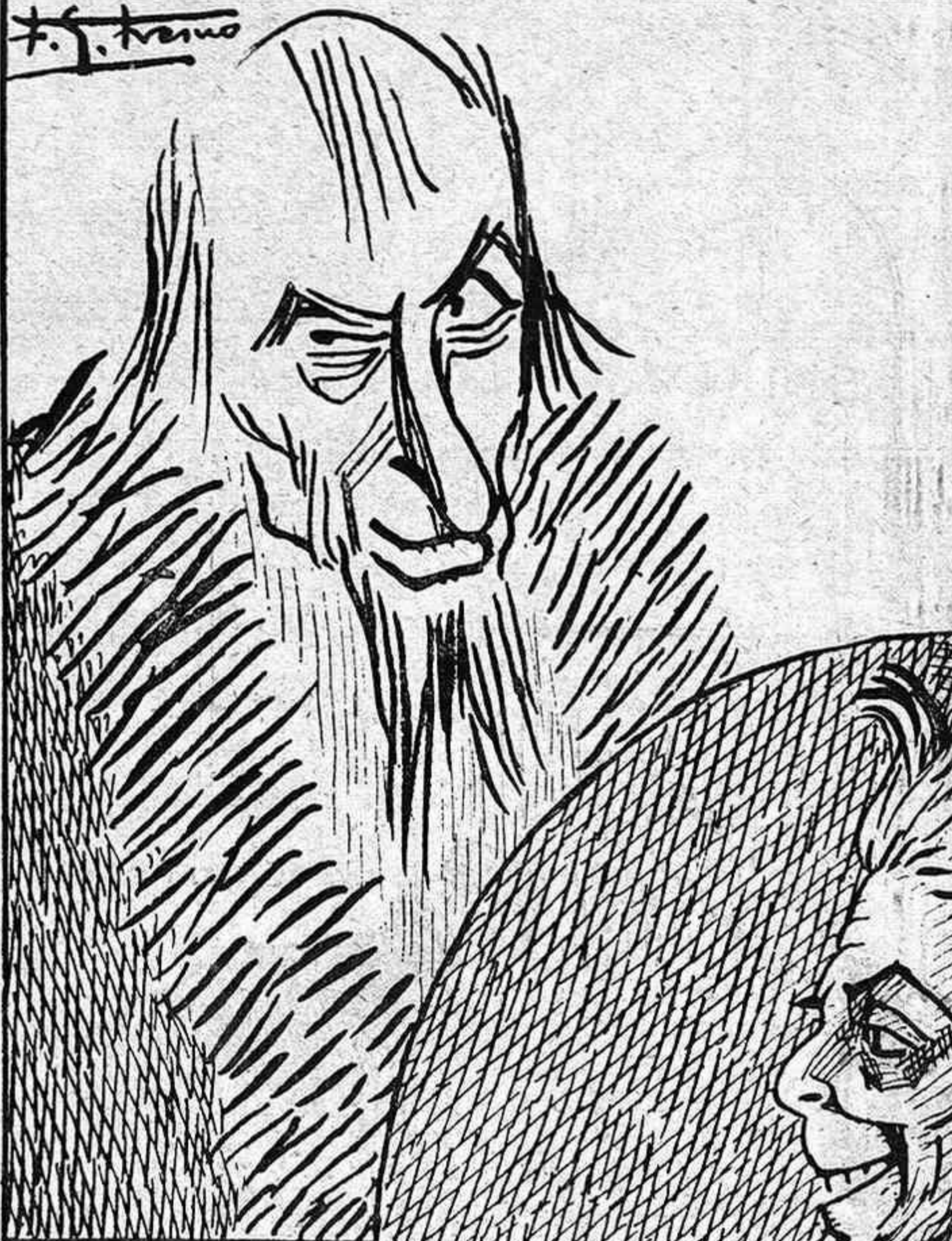
LA ESCONDIDA SENDA